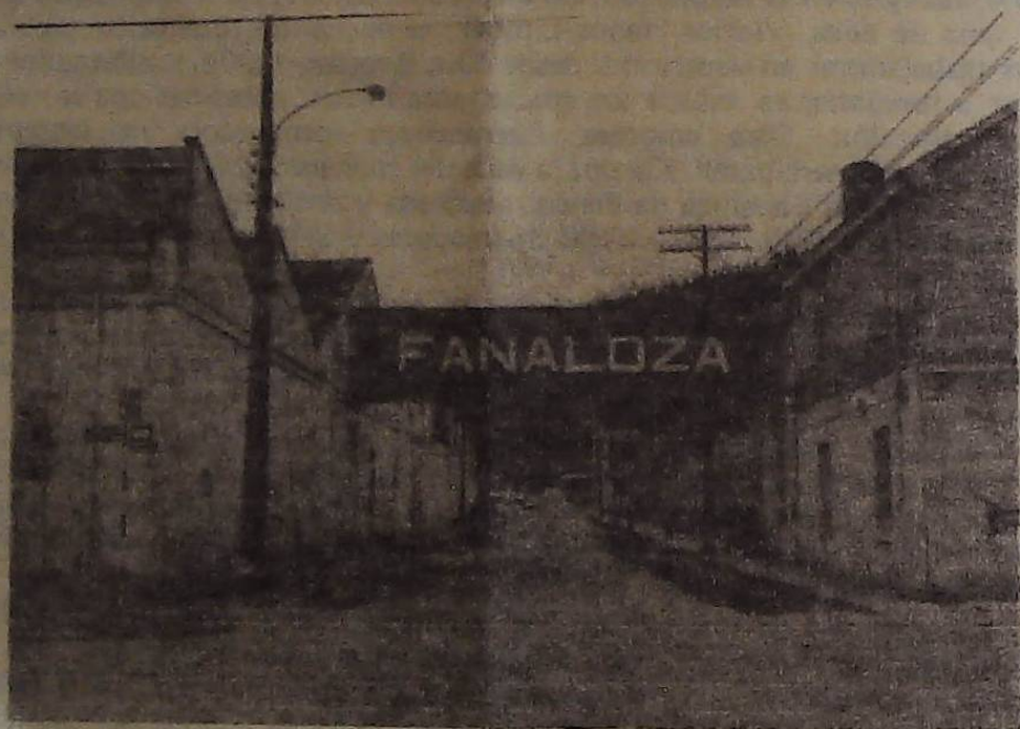
PLANTA FANALDOZA DE PENCO (VIII REGION)

Toda esta situación crítica que hemos descrito, ha afectado de manera muy aguda al movimiento sindical de la Región, el cual no ha podido encontrar caminos de unidad ni de acción efectiva. ●