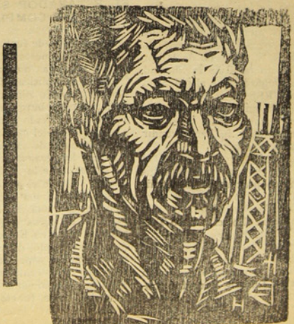
madera, de bugueño

De la extensión agrícola aprovechable del país sólo se utiliza en la actualidad un 2 por ciento. Hay enormes extensiones de terreno que con obras de regadío convenientes podrían hacerse tan útiles como todas. Algunos ejemplos bastarían para demostrarlo: En Coquimbo hay 1,700,000 hectáreas de terrenos agrícolas y consideraciones siguientes: (Pasa a la pág. 6).