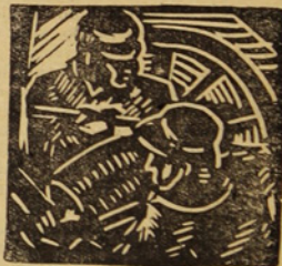
(De la vuelta)

puede ser removido por los electores y puede en sus actos de acuerdo con las normas generales que le ha dado su respectivo Consejo bajo su entera responsabilidad, obligándose, si es necesario, a rendir cuentas de sus errores o de sus desviaciones políticas y aplicándosele las sanciones necesarias.