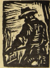
(Viene de la página 3)

Hitler prometió en su programa expropiar grandes latifundios. Pero ya en el poder ha cambiado de opinión. Los grandes latifundistas o junkers han recibido plenas garantías de que sus propiedades no serán tocadas. Estas grandes propiedades suministrarán el 68% de los artículos destinados a los mercados nacionales y mundiales.