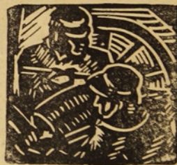
(De la página 6)

En suma: hé aquí un perfecto ejemplo de la crueldad automática del régimen capitalista.