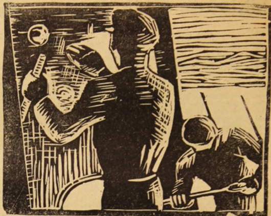
linoleum de d. salinas

¿qué significan los diferentes grupos estudiantiles?