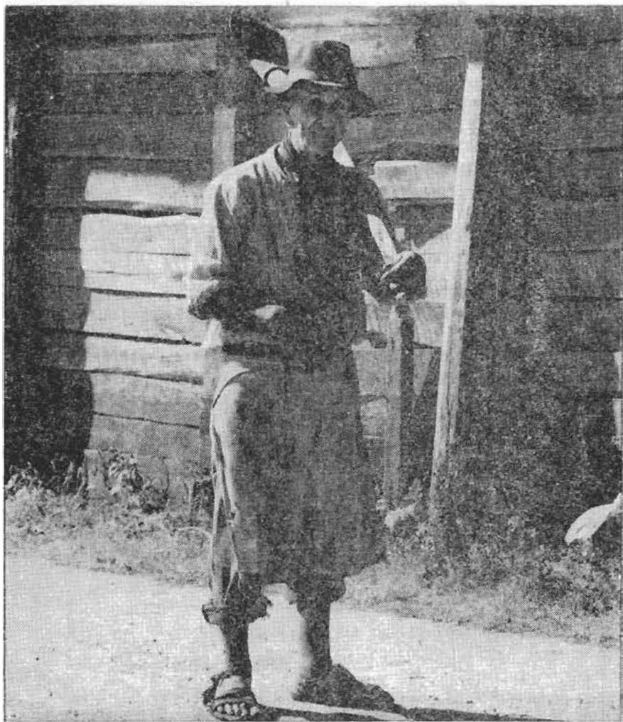
Al campesino chileno se le darán nuevas y más dignas condiciones de vida