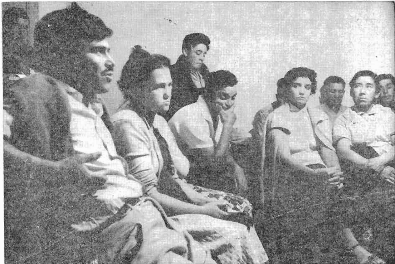
El campesino chileno delibera y participa en los objetivos de la Reforma Agraria