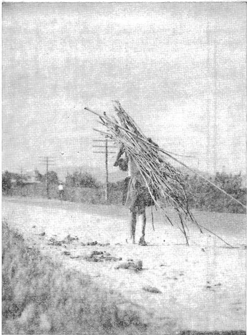
El niño campesino asistirá a la escuela y dejará estas penosas actividades