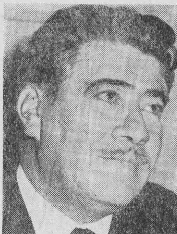
ANICETO RODRIGUEZ, Secretario General del PS.

Esta doctrina, formalícese o no a través de