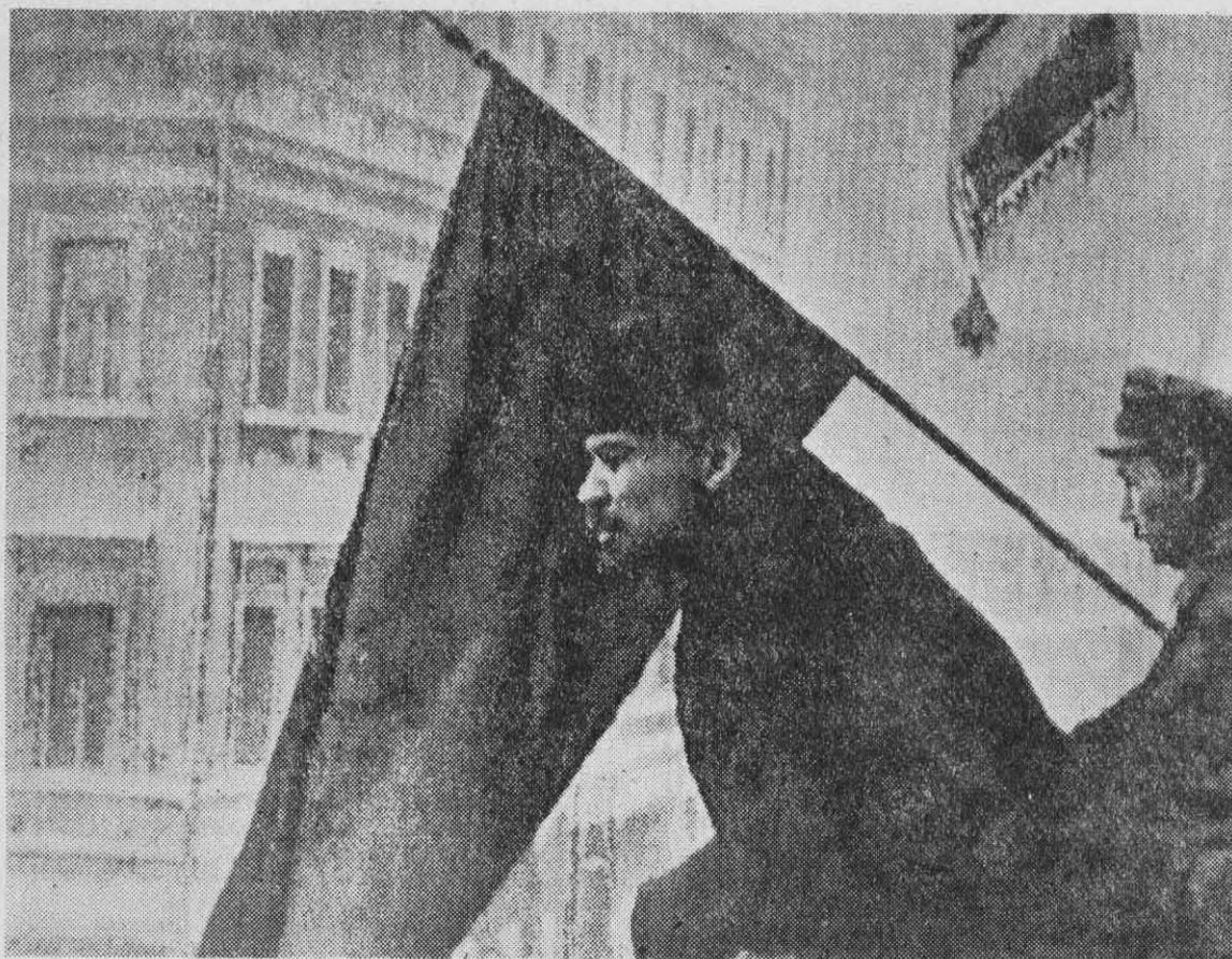
LENIN, en octubre de 1917, marcó un camino de decisión y lucha para los revolucionarios del mundo.