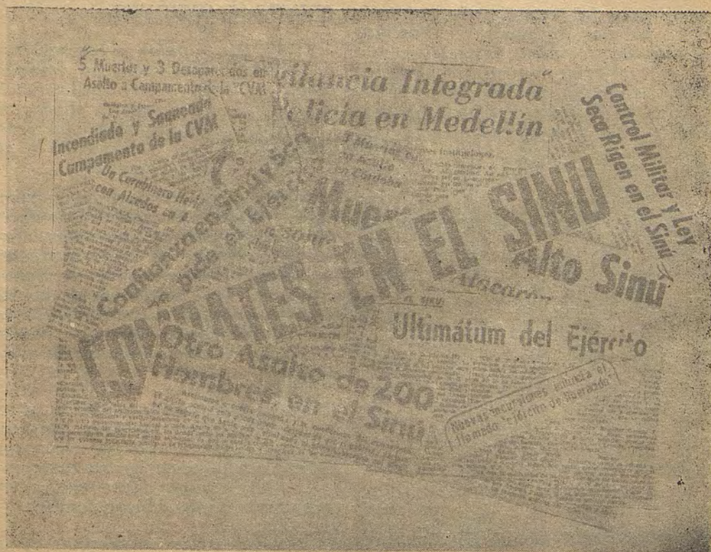
Titulares de periódicos colombianos dando cuenta de las acciones en la zona de lucha

El 16 de enero, en Santander, los patriotas emboscaron una patrulla militar, causándole tres muertos.