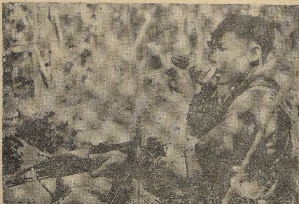
Desplegando todo su poder combativo, los soldados de las Fuerzas Armadas de Liberación del Pueblo de Vietnam del Sur aniquilan a los agresores yanquis

El comunicado señala que en los cuarenta y cinco días las FAPL y el pueblo se han fortalecido y han logrado victorias sucesivas mientras que el enemigo se ha debilitado cada día más y ha sufrido repetidas derrotas, hundiéndose más profundamente en una posición pasiva sin salida.