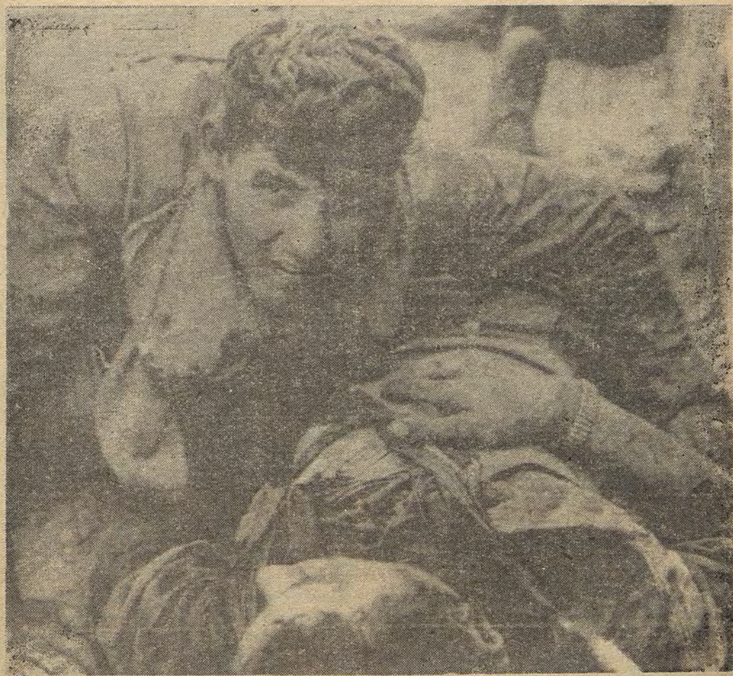
La foto muestra a los agresores yanquis en HUE, en tremenda confusión, cuando las Fuerzas Armadas de Liberación del Pueblo de Vietnam del Sur desencadenaron su ataque el 3 de Febrero

volaron trescientos cincuenta puentes; destruyeron trescientos depósitos y liberaron más de setecientas aldeas y case-