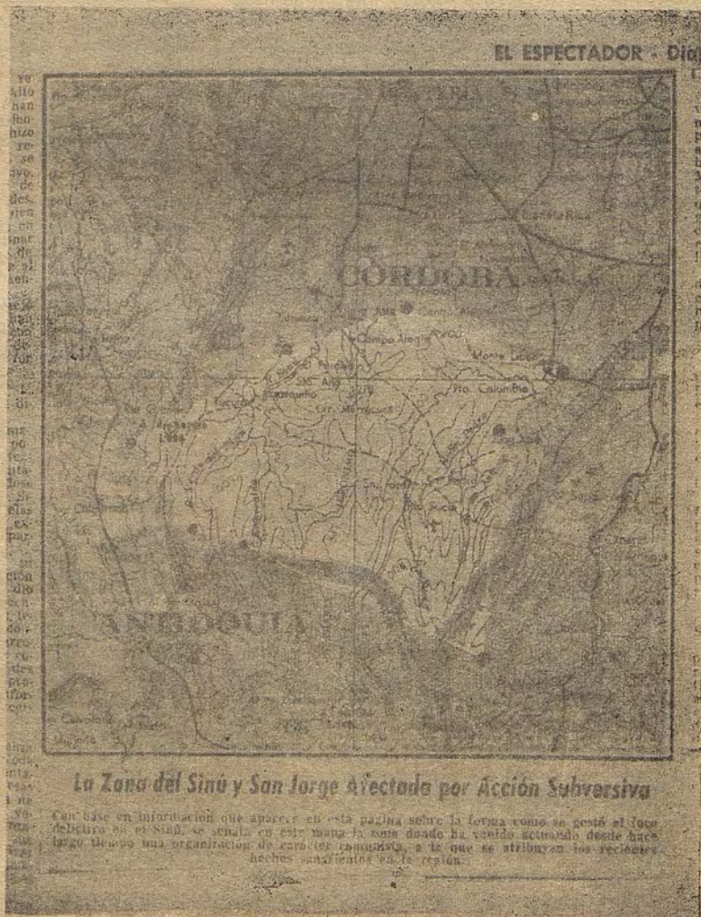
Mapa de la zona donde actúa el Ejército de Liberación