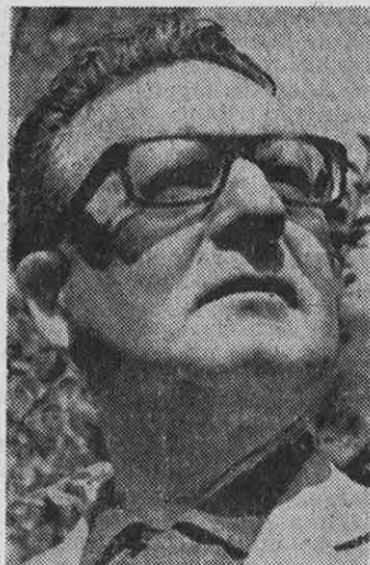
ALLENDE: el gobierno lleva el país al caos.

Creo que existe una voluntad en ese sentido, pero que a veces no alcanza expresión definida por la falta de una conducción política adecuada. Esa situación constituye un reto para la izquierda, que la invita a recti-