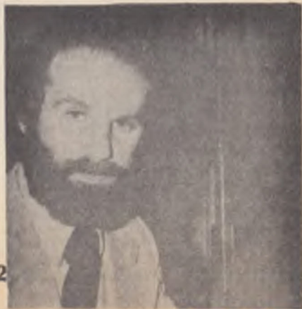
Fiscal Eugene Propper.

A juzgar por los resultados —traducidos en cambios ministeriales; "amnistía"; promesa de Constitución; etcétera— que para la oposición no significan gran cosa pero para Pinochet y sus secuaces son indudablemente una derrota, la maniobra norteamericana, que nadie sabe aún dónde finalizará, no ha dejado de tener éxito.