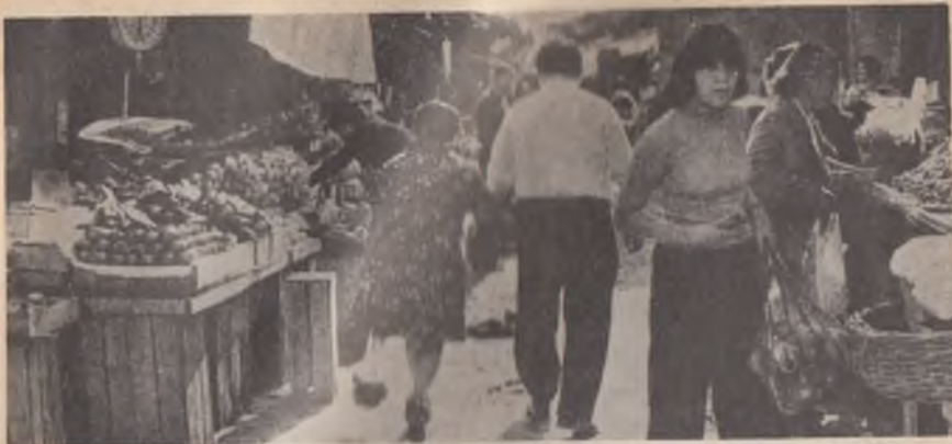
Los sueldos bajan, los precios suben.

de 47.7 a 58.9. Pero esta drástica concentración de la riqueza no se ha traducido en inversión.