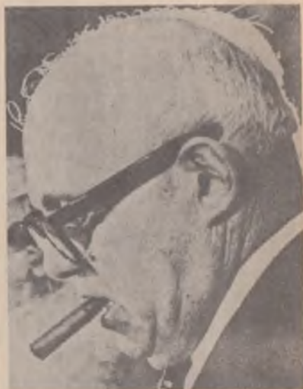
George Meany, presidente de la AFL-CIO: propuso el boicot y ahora lo está negociando.

Mirando retrospectivamente este problema, hay que recordar que en mayo del año pasado, una delegación de la AFL-CIO (American Federation of Labor and Congress of Industrial Organiza-