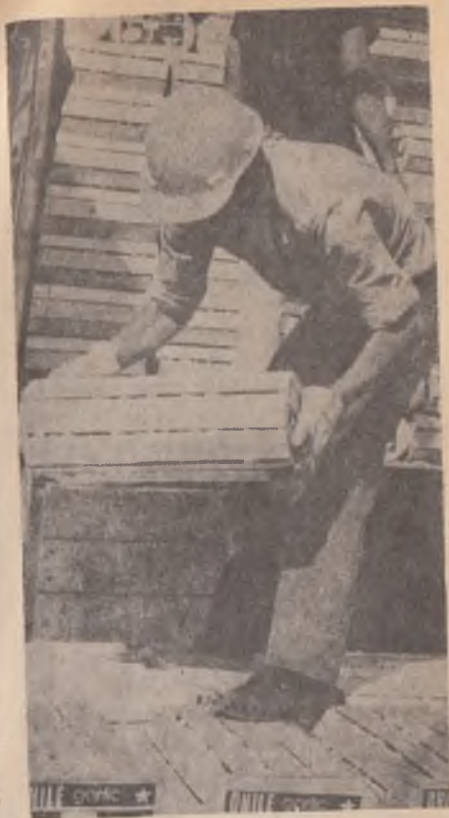
Nadie en el exterior se atreve a comprar fruta chilena.

Ésa es la situación actual del boicot a Chile. El acuerdo tomado en Lima sigue vigente. Los sindicatos de la región estudian la forma de llevarlo a efecto, aunque en el interior, los sectores más reaccionarios luchan para