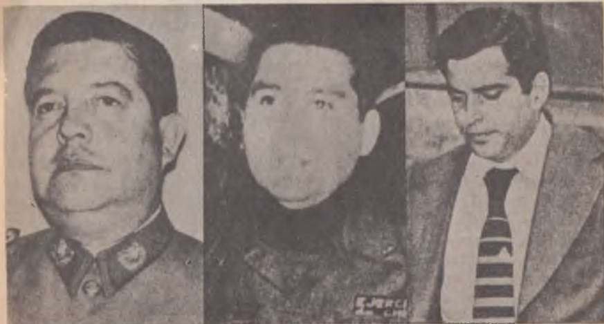
El general Contreras, coronel Espinoza y capitán Fernández: asesinos y torturadores de la DINA.

tados Unidos a Chile. Señalando en días pasados que “ahora más que nunca creen en la inocencia de sus defendidos”, Balmaceda dejó atónitos a los periodistas cuando dijo: “No sé para qué pidieron las extradiciones. Hubiera sido preferible una con-