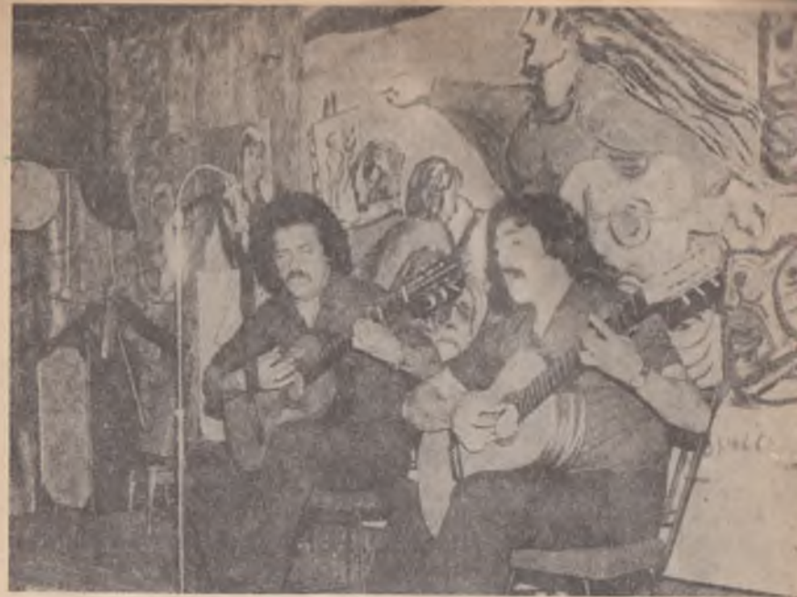
Vuelven las "peñas" en Chile. Y las canciones-protesta.

La verdadera fuerza de un pueblo amante de la libertad no