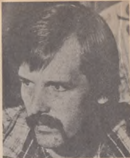
Townley: asesino y delator.