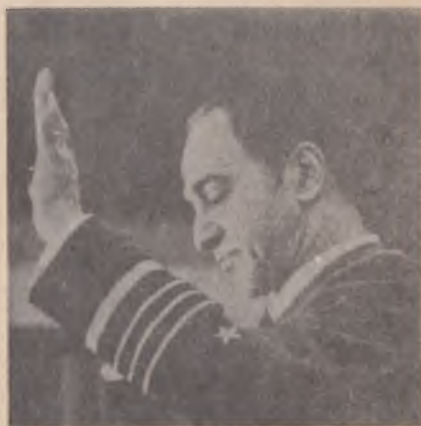
Leigh: la nueva Constitución sólo sirve para la basura.

Reconoció que cuando integraba la Junta disponía de po-