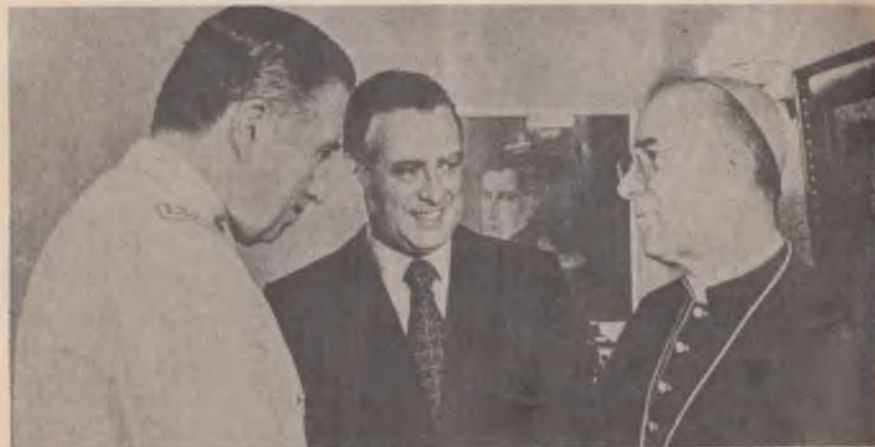
Pinochet, el canciller Cubillos y el cardenal Antonio Samoré, enviado especial del Papa para "poner en la buena" a dos dictaduras.

A partir de entonces el debate sobre el Beagle cambia de naturaleza. Los imperativos surgidos de la "guerra interna" declarada por las dictaduras a sus pueblos, con el fin de proceder a reubicar a Chile y Argentina en el nuevo orden económico internacional dentro del marco de la crisis prolongada del capitalismo internacional, transforma el "proble-