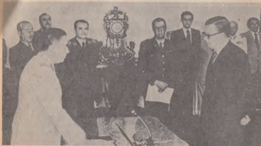
La crisis económica, el boicot y los desaciertos del régimen obligaron a Pinochet a nuevos cambios de gabinete. Jura ante el dictador el nuevo ministro de Educación, Gonzalo Vial.

La acción de estos tres "trabajadores" rindió sus frutos en el seno de la ORIT, al conseguir,