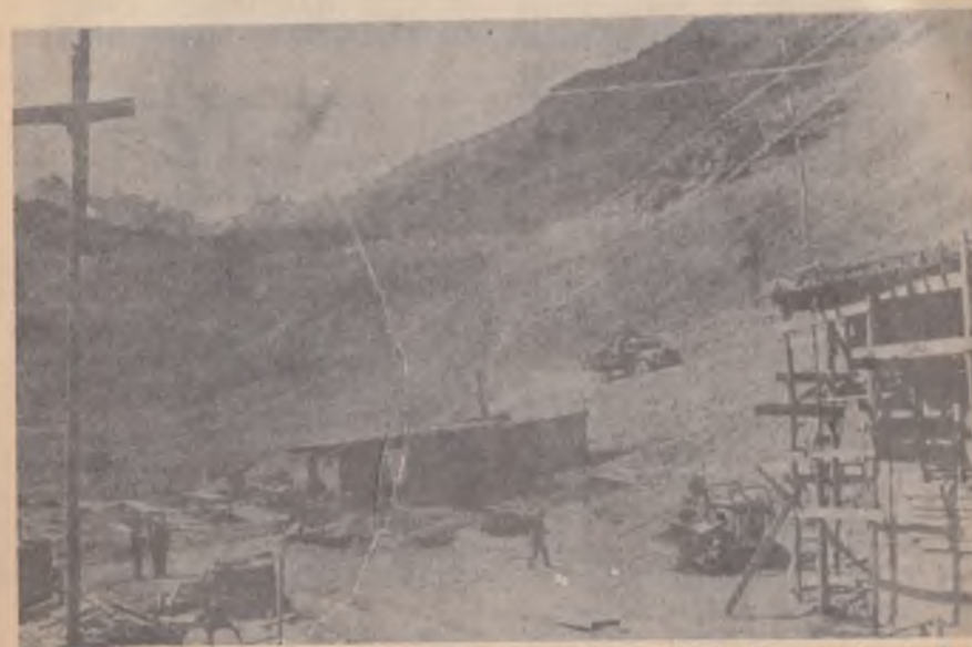
La Exxon: del petróleo al cobre. Nueva dueña de la Disputada de Las Condes.

Según ODEPLAN, la menor demanda internacional hizo bajar la producción de acero en Chile en 1978 en un 38 por ciento respecto del año anterior. Japón, que absorbía el 85% de la producción de la Compañía de Acero del Pacífico, la principal usina chilena, bajó notablemente su compra de acero chileno. Hasta septiembre de 1978 la producción de hierro en Chile era de