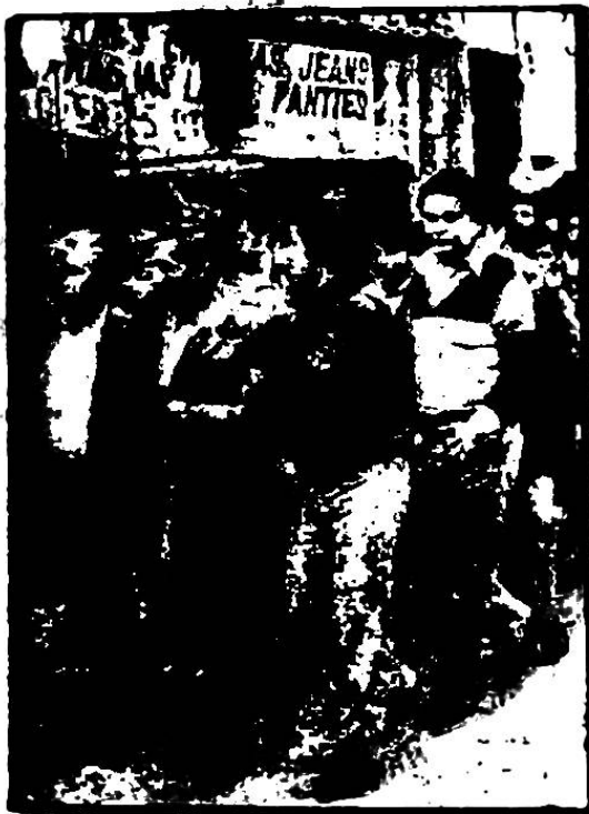
Marcha de los mineros: dos brazos quebrados y más de diez detenidos