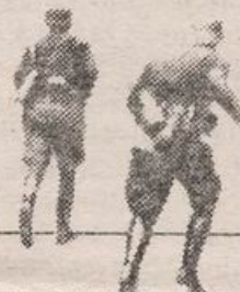
HITLER INVADE POLONIA