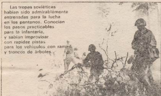
Las tropas soviéticas habían sido admirablemente entrenadas para la lucha en los pantanos. Conocían los pasos practicables para la infantería, y sabían improvisar con rapidez pistas para los vehículos con ramas y troncos de árboles.

El 6 de diciembre de 1941, en las cercanías de Moscú, el ejército alemán sufrió el primer gran revés. La derrota de los alemanes en las cercanías de Moscú repercutió en todo el curso posterior de la guerra.