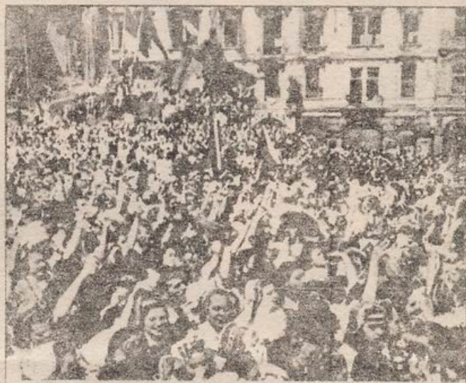
△ En la Praga liberada, el pueblo checo aclama a los soldados del Ejército rojo.

Ambos movimientos tenían asimismo magna importancia internacional, pues eran una poderosa manifestación de la lucha de las más vastas masas populares contra el "nuevo orden" fascista.