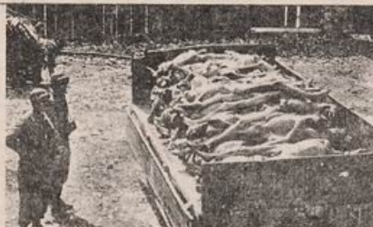
◁ Terrífica imagen del sistema de campos de concentración nazi: cadáveres de prisioneros en Buchenwald.

Antes del inicio de la guerra, las SS comenzaron a construir la infraestructura de los campos de