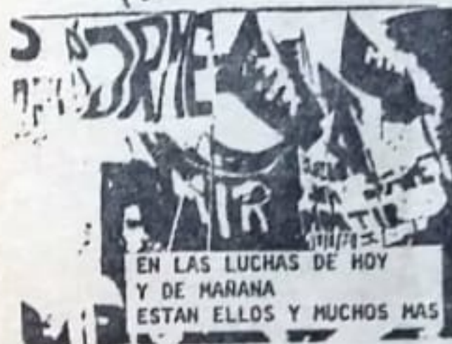
EN LAS LUCHAS DE HOY Y DE MAÑANA ESTAN ELLOS Y MUCHOS MAS

Evocar a nuestros héroes y mártires, a quienes entregaron todo -hasta la vida- en esta lucha por liberarnos de la tiranía, retomar sus enseñanzas que forman parte de nuestra historia colectiva, nos fortalece para los combates del presente y del futuro.