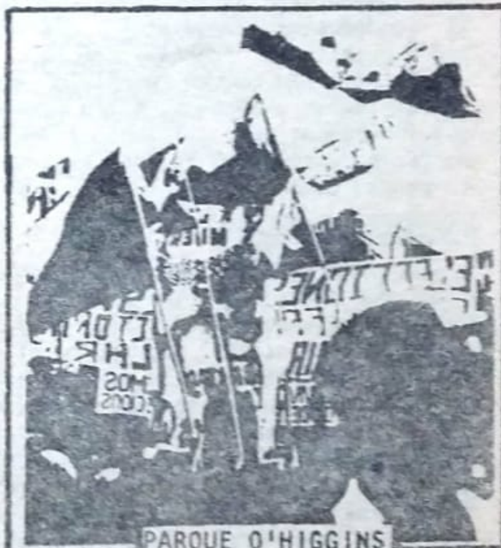
PARQUE O'HIGGINS 19 DE NOVIEMBRE

EL HAMBRE CON NO SE ACABA NI CAMPAÑAS ELECTORALES!