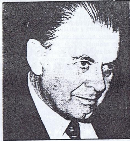
IU "PREOCUPACION PROFUNDA"

xistas —es decir aproximadamente un tercio del país— y se propicie por otra parte la inscripción en la ley de partidos a sabiendas que ninguno de los partidos de la Izquierda chilena podría hacerlo, aún si esa fuera su decisión?. Si eso no es una actitud que en términos cristianos se llama farisea, habría que preguntarse que otro nombre se le puede dar.