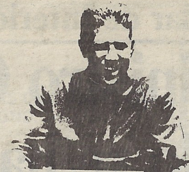
PADRE ALBERTO HURTADO UN PADRE PARA CHILE

Por su parte, Carlos Briones, quien fuera ministro del Interior de Allende