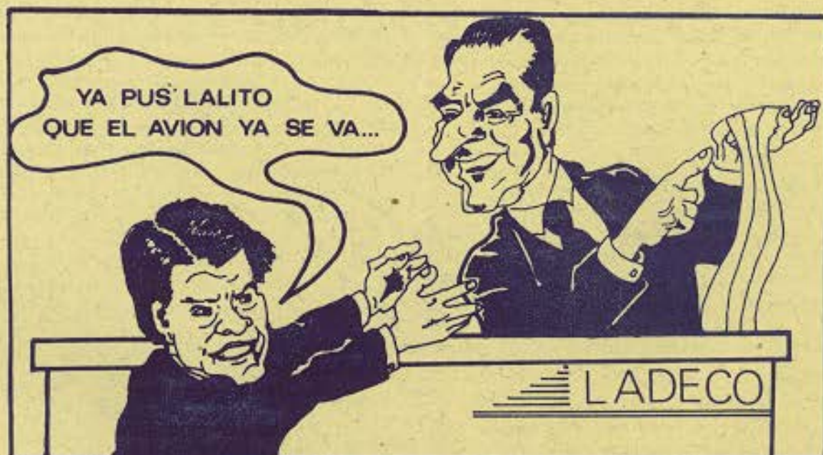
AEROPUERTO ARTURO MERINO B., Lunes 13 de Junio, 11 horas...

** ¡ SOMOS EL FUTURO ! porque con nuestra lucha, con nuestra capacidad, con nuestra unidad, con nuestra audacia y con nuestro fuerte compromiso con los más desposeídos convertiremos el futuro en nuestro... *****