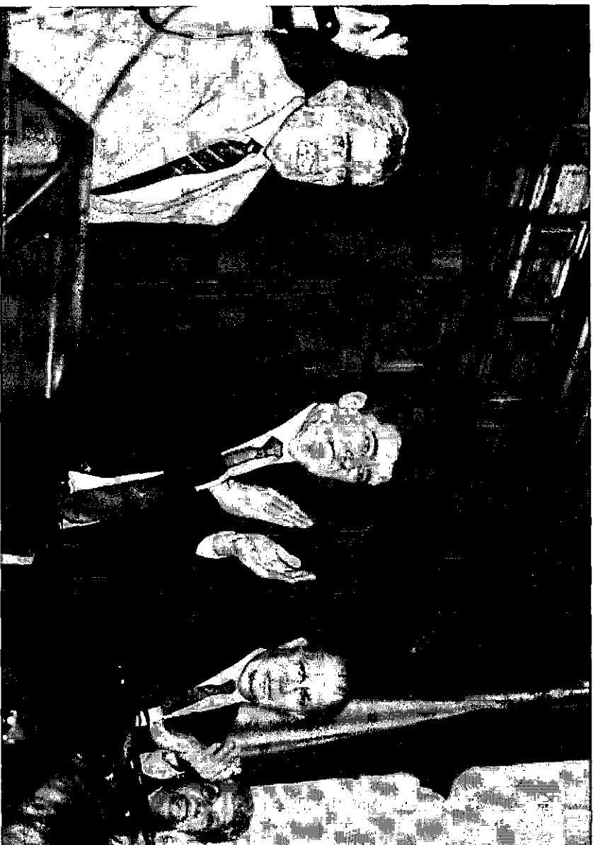
1996: Último Homenaje en el ex Congreso Nacional. De izquierda a derecha: Raúl Ampuero, el Diputado Camilo Escalona, Sec. General del PS, el entonces Ministro de Obras Públicas Ricardo Lagos y la ex Diputada Carmen Lazo.