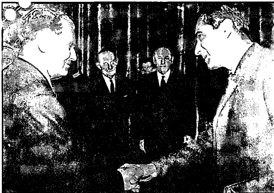
Con el Mariscal Tito, en Belgrado, ex Yugoslavia, durante los peores años de la Guerra Fría, sosteniendo la política de los No Alineados.