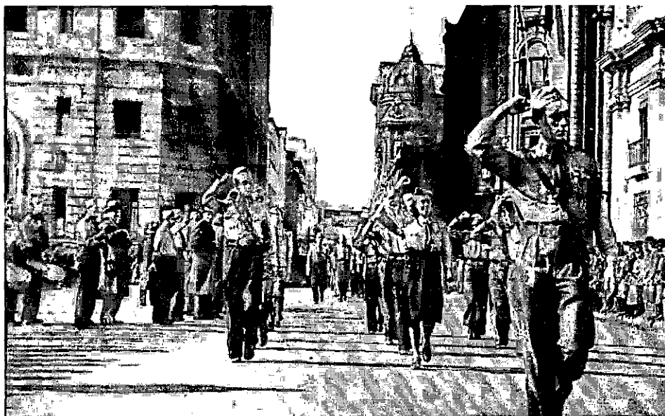
La Federación Juvenil Socialista desfila frente a la Moneda, en 1939. Las Milicias Socialistas enfrentaron en las calles a las Tropas Nazis de Asalto de Gustavo Von Maré.