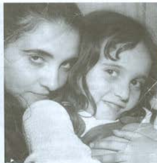
Según su madre, Michelle era "alta, fornida, de tez blanca, ojos muy grandes de color

En 1967, ingresó a la Juventud Socialista en su universidad. Durante el Gobierno de la Unidad Popular, Michelle alternó sus estudios con actividades laborales en el Instituto Chileno-Vietnamita de Cultura en donde se desempeñó como bibliotecaria- y como secretaria de los sindicatos obreros de Mademsa y Cristalerías Chile.