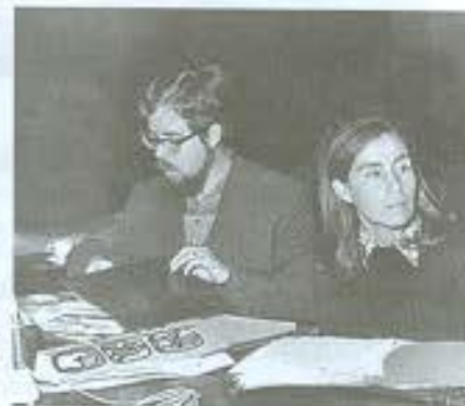
expulsión del país de un importante miembro del equipo de organización del PS, presuntamente detenido en Villa Grimaldi y Colonia Dignidad.