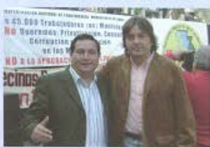
El Concejal Miguel Angel Aguilera y el Diputado Tucapel Jimenez.