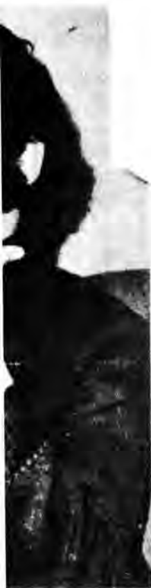
ente del Cordón