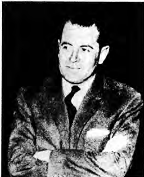
Patricio Aylwin. Presidente del Partido Demócrata Cristiano.