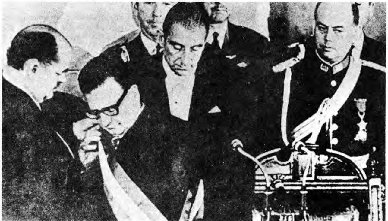
Allende asume la Presidencia de la República.