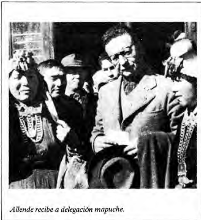
Allende recibe a delegación mapuche.