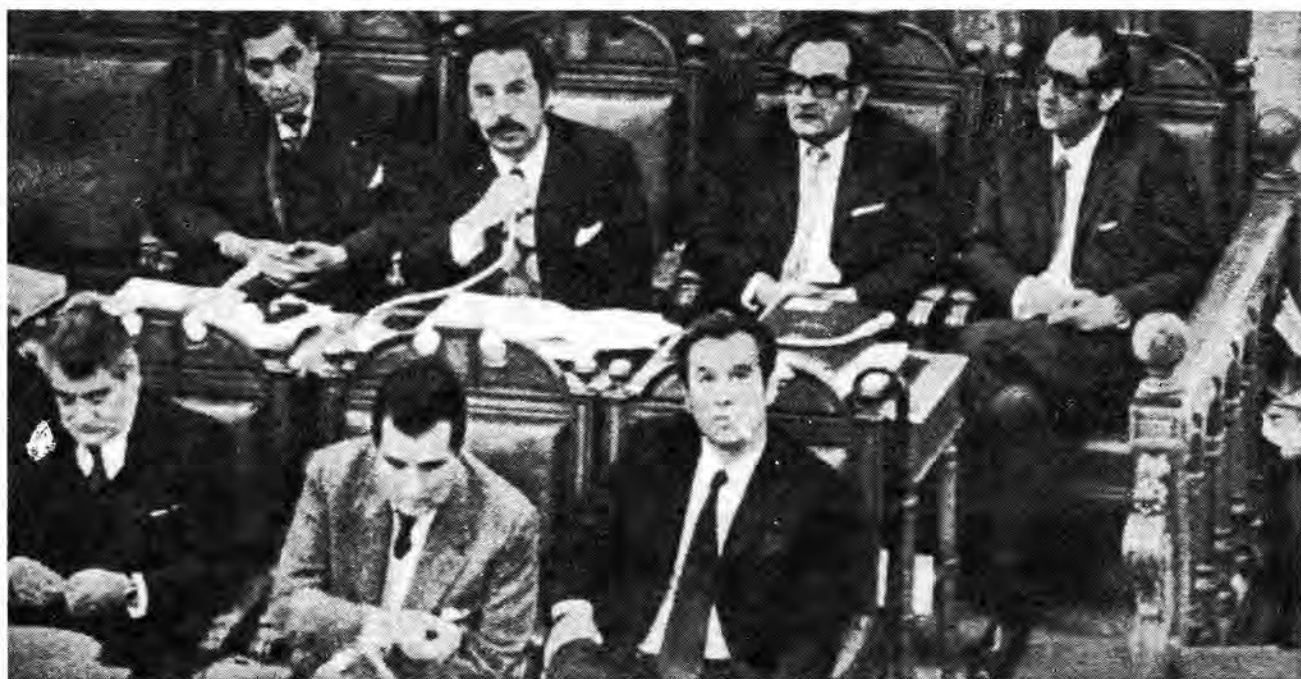
Ministro de Justicia, Jorge Tapia comparece ante el Senado de la República.