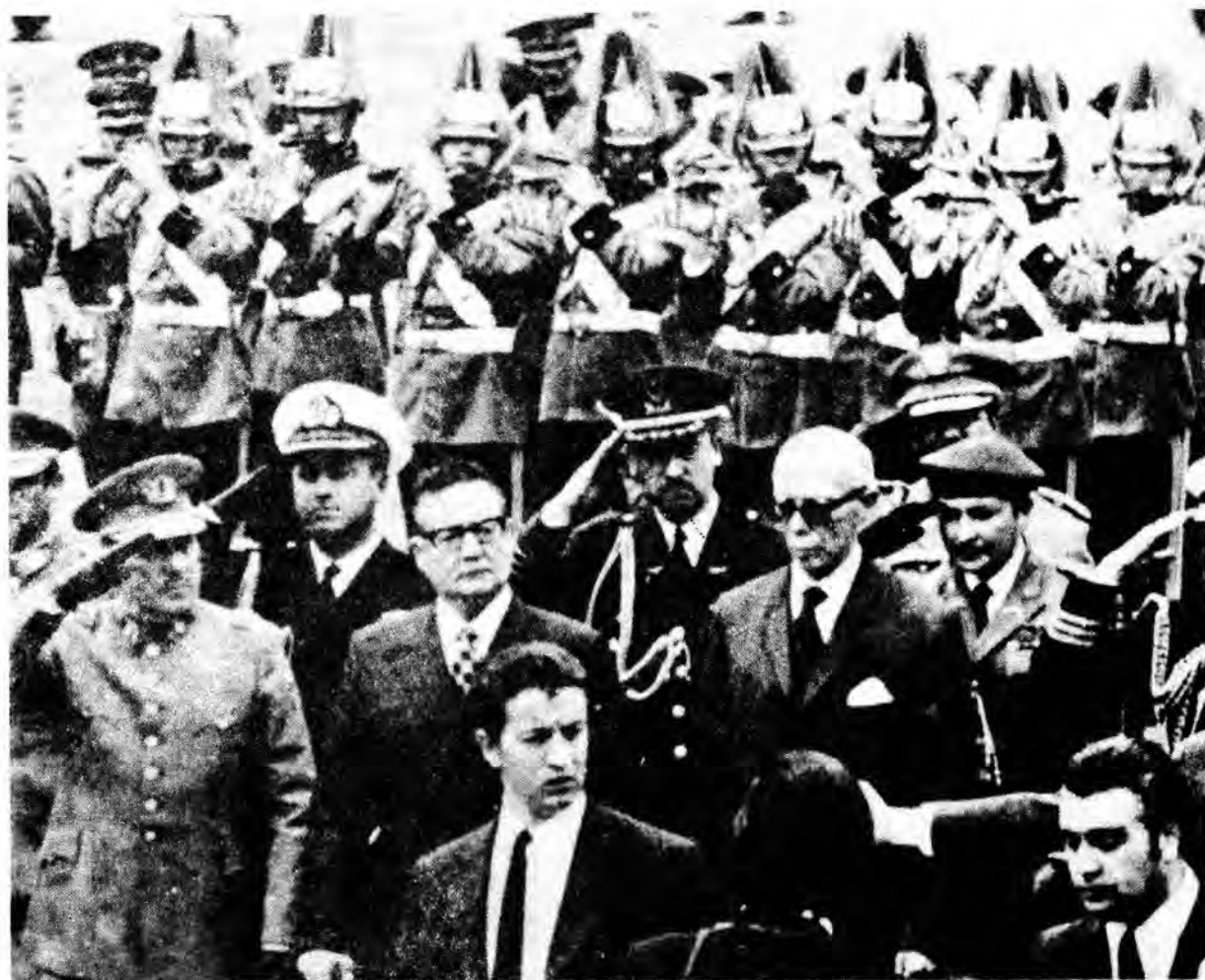
Presidente Allende y el Presidente de Ecuador José M. Velasco Ibarra.