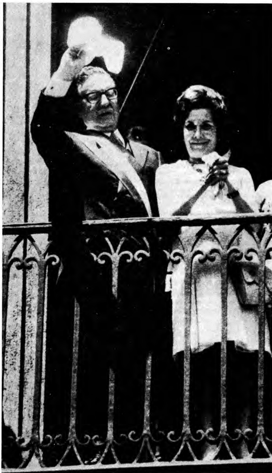
El Presidente Allende junto a su esposa Hortensia Bussi saluda desde el balcón del Palacio de La Moneda.