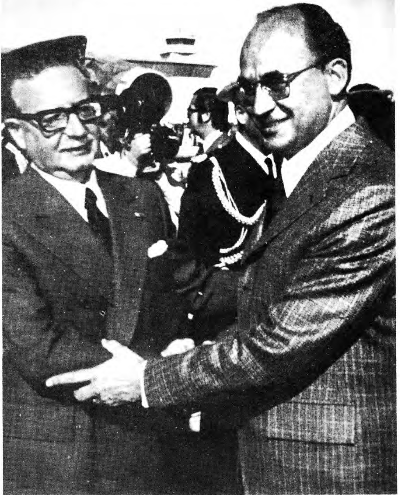
Presidentes Allende y Echeverría: comienzos de una noble amistad.