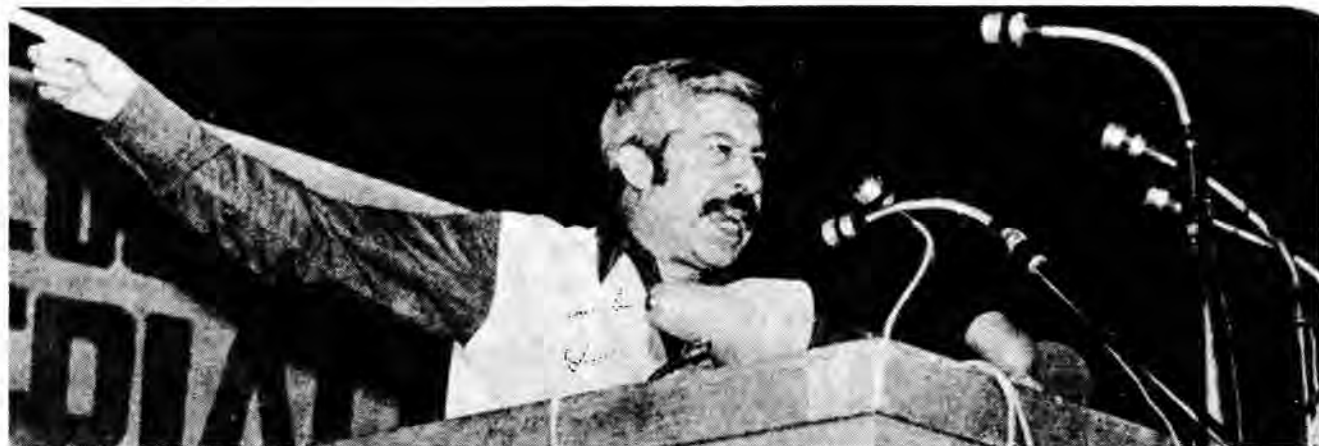
Luis Figueroa, Presidente de la CUT.