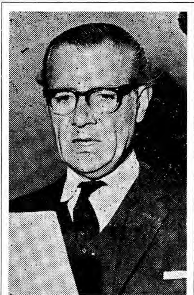
Eduardo Novoa Moreal. Jurista que dirigió los estudios de la nacionalización del cobre.