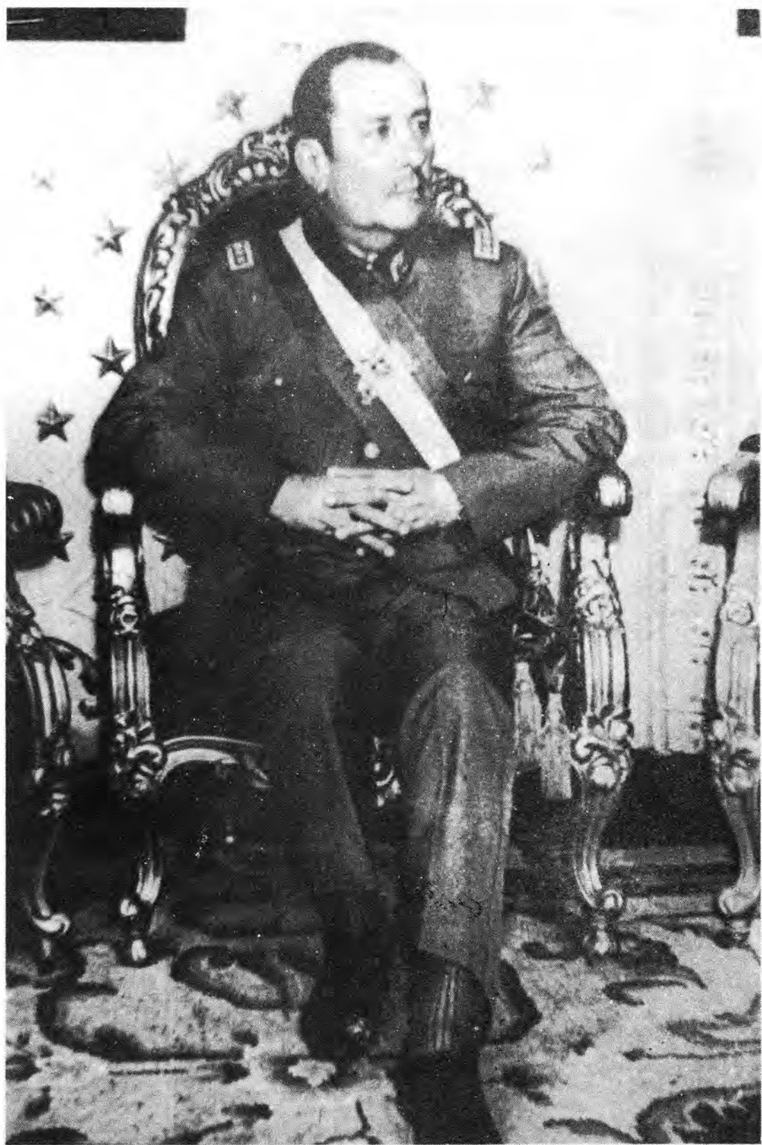
General Carlos Prats en el desempeño de la Vice-Presidencia de la República. 1972.