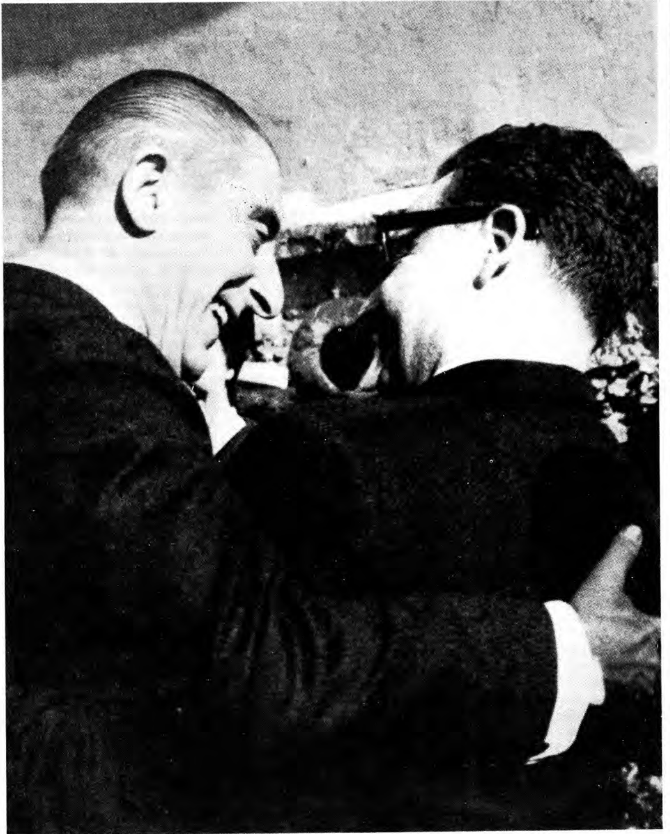
Frei y Allende: de la amistad al conflicto.