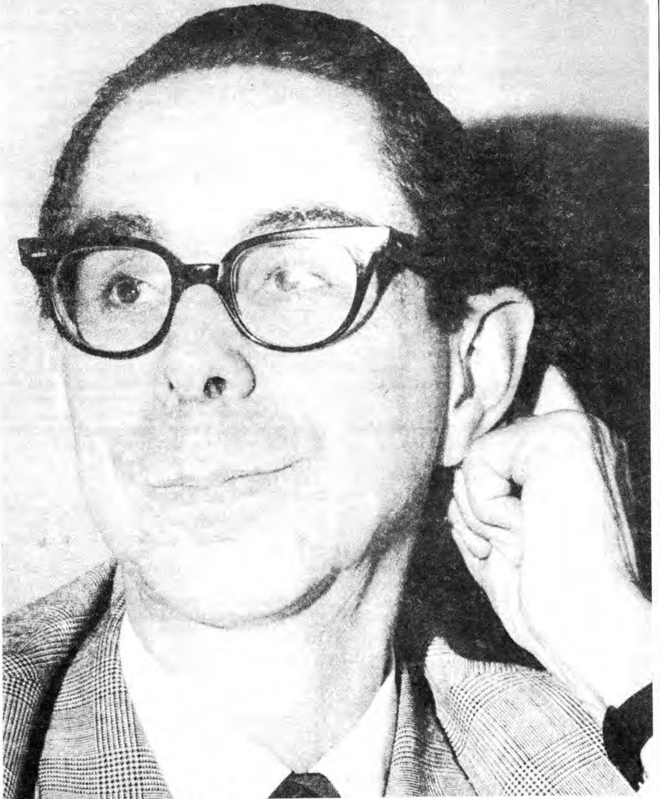
Carlos Altamirano, Secretario General del PSCH.