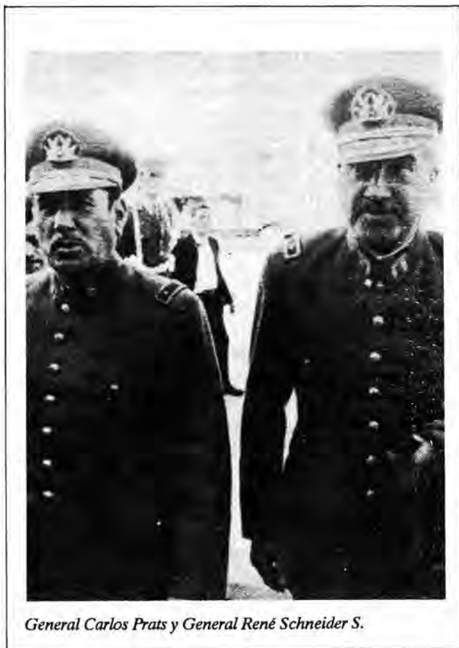
General Carlos Prats y General René Schneider S.