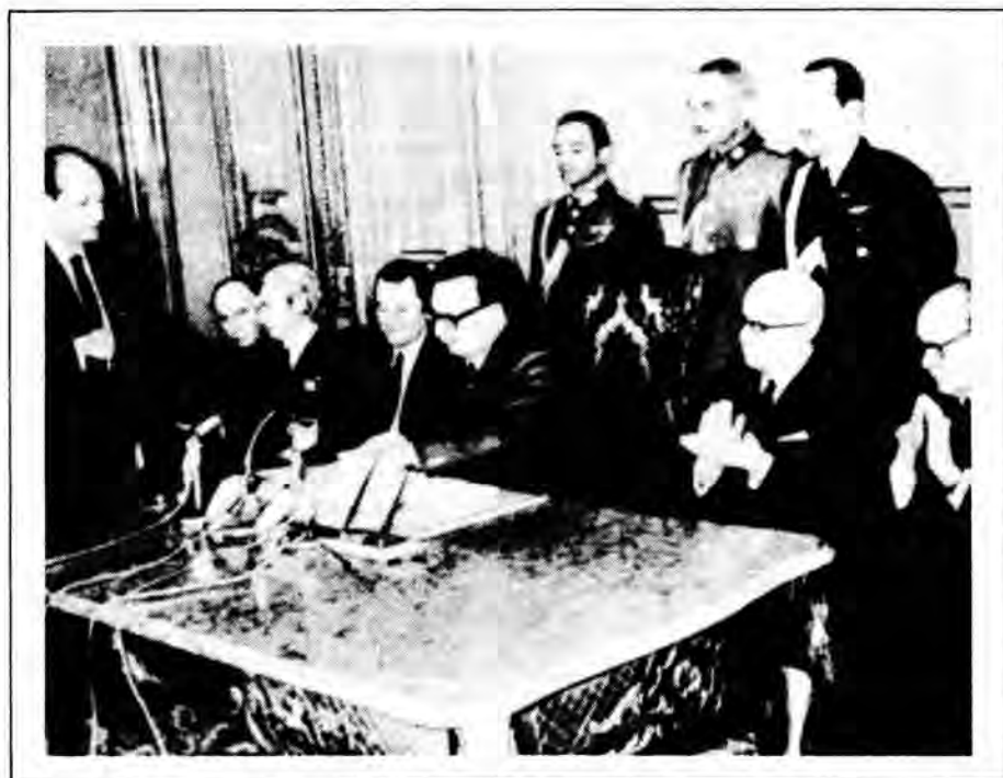
Presidente Allende firma decreto sobre indemnización a Compañías del Cobre. De pie a su derecha, Ministro de Minería Orlando Cantuarias.