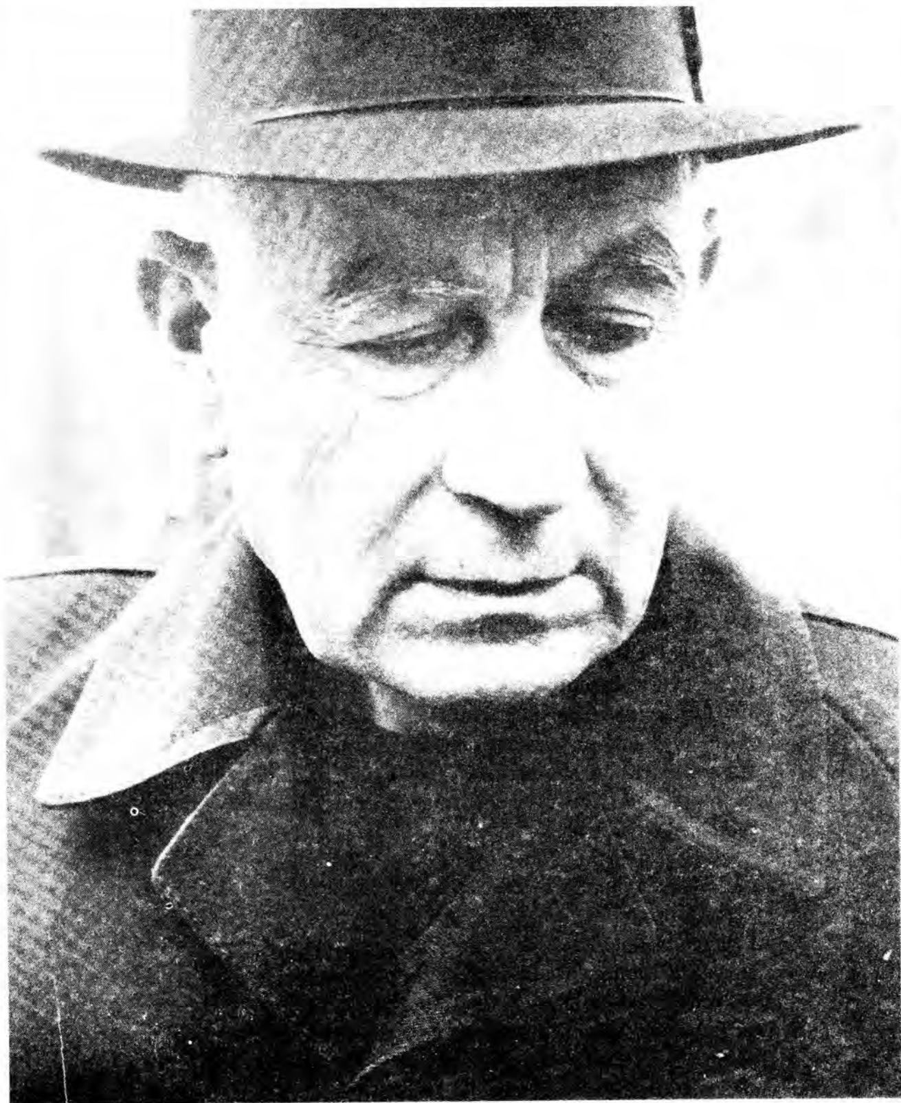
Monseñor Raúl Silva Henríquez. Principal defensor de los derechos humanos en Chile en los años de la dictadura militar: 1973-1978.