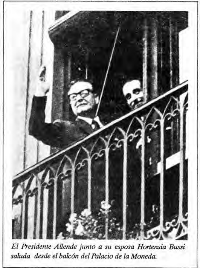
El Presidente Allende junto a su esposa Hortensia Bussi saluda desde el balcón del Palacio de la Moneda.