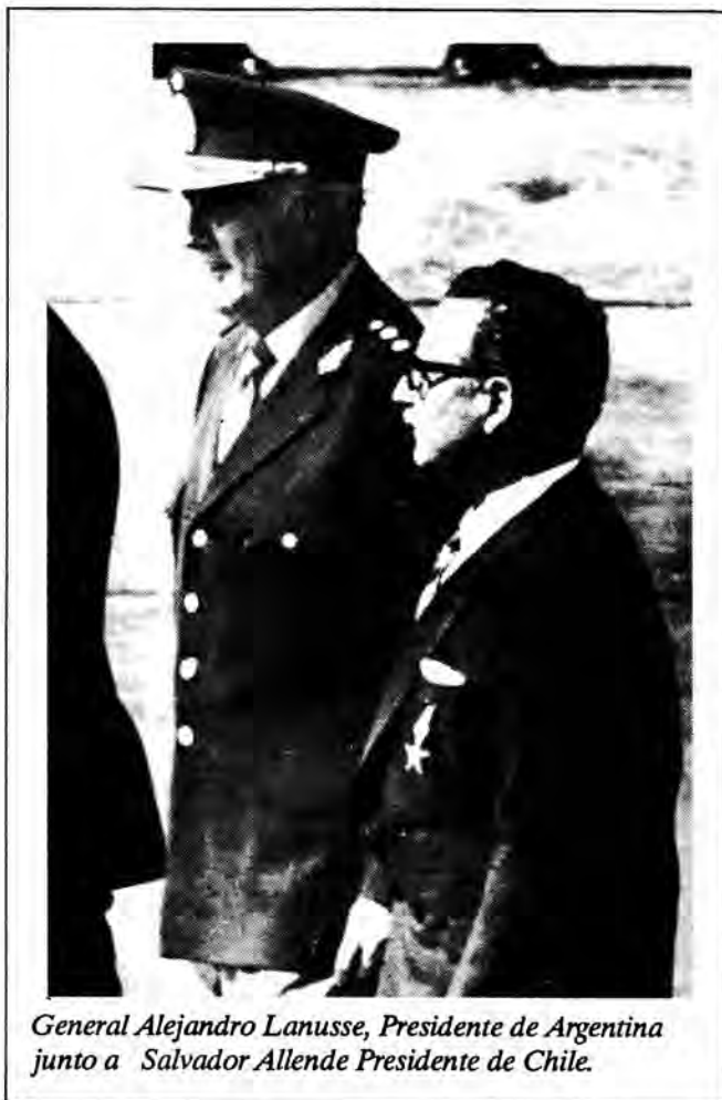
General Alejandro Lanusse, Presidente de Argentina junto a Salvador Allende Presidente de Chile.