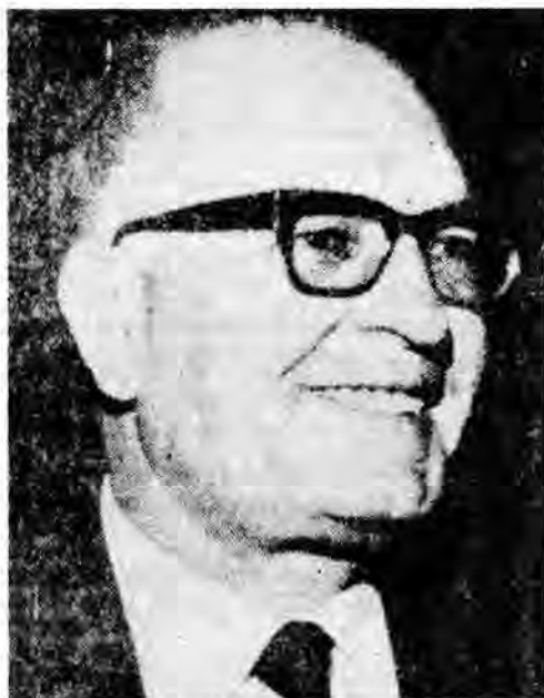
Edmundo Pérez Zujovic