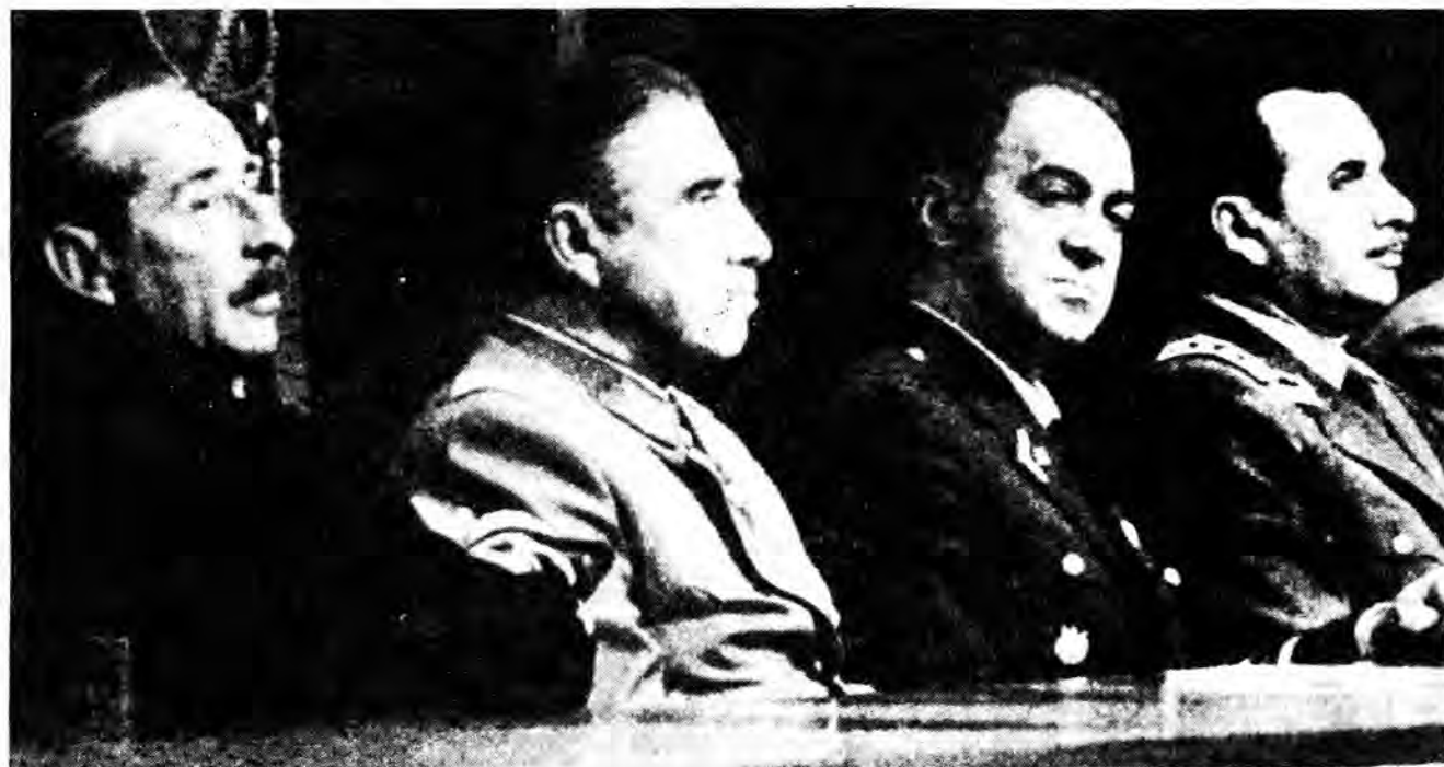
Junta Militar: Almirante José Toribio Merino, General de Ejército Augusto Pinochet, General de Aviación Gustavo Leigh, General de Carabineros César Mendoza.

9.00 Se cumple el plazo y La Moneda no es bombardeada. Funcionarios y empleados abandonan el edificio por pedido de Allende.