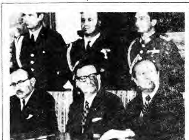
Presidente Allende junto al Presidente de Colombia Misael Pastrana Borrero.