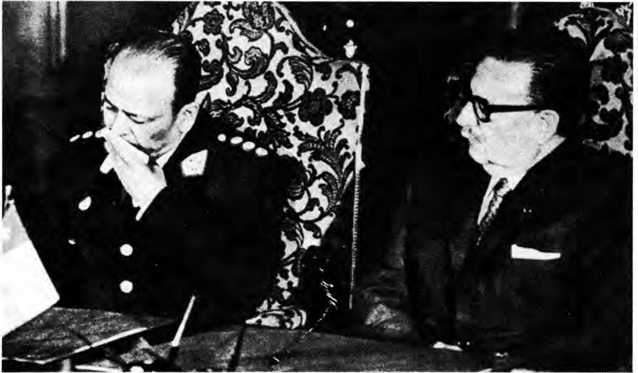
Presidente de Perú Juan Velasco A. y Presidente Salvador Allende.

Reafirma la vocación latinoamericana de defender los intereses de la región, de la paz y del derecho.