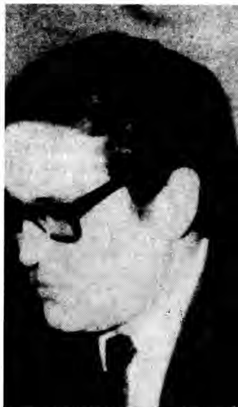
Luis Maira. Presidente del Partido Federado de la Unidad Popular.