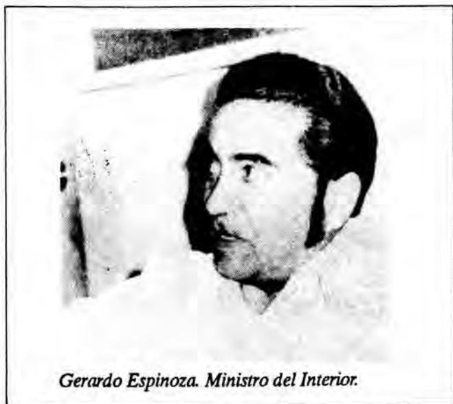
Gerardo Espinoza. Ministro del Interior.