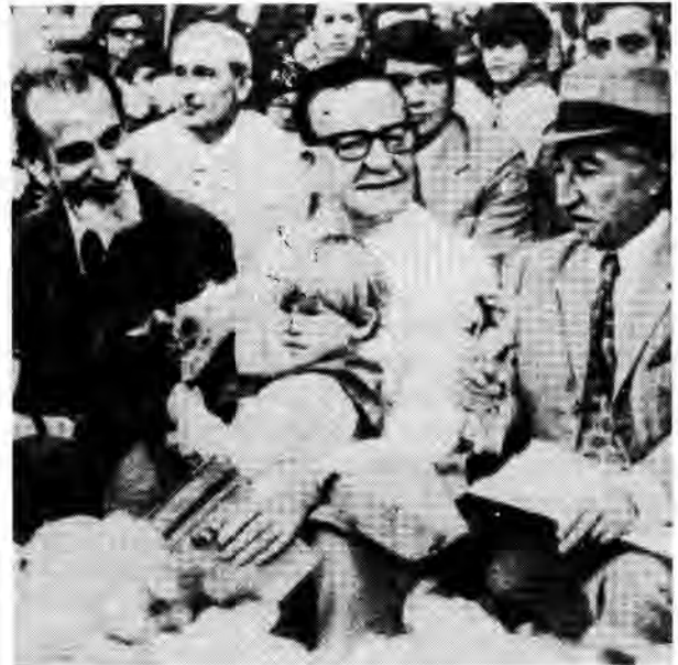
Presidente Allende en el Estadio Nacional (5-XI-1970). A su derecha José Tóhá, a su izquierda Luis Corvalán.