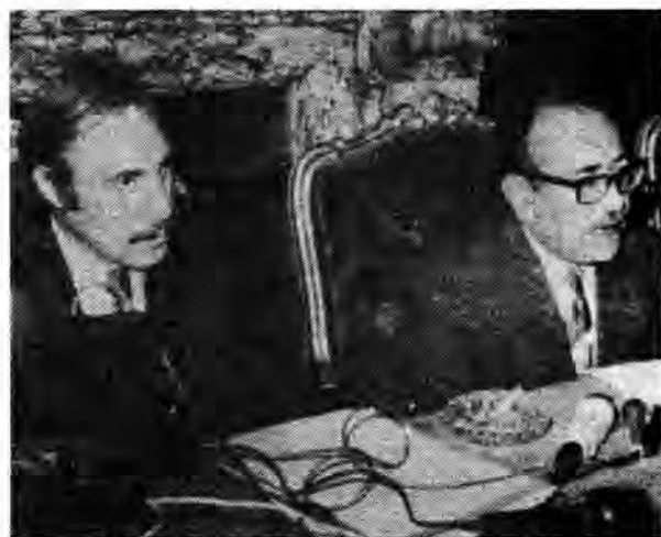
Orlando Letelier, Embajador en Estados Unidos y Clodomiro Almeyda, Canciller del Gobierno Popular.

tas. Según El Mercurio de la fecha, cuando Allende se va a retirar, uno de los reporteros gráficos le pide: "¡Espere un momento, Excelencia!" A lo que responde el interpelado: "¡Excelencia, no, Compañero Presidente". El mismo matutino pone en boca de Alejandro Ríos Valdivia, designado ministro de Defensa: "Creo que podré realizar una labor en condiciones favorables. Conozco a prácticamente todos los generales del Ejército y a muchos de los coroneles, desde que llegaron como cadetes a la Escuela Militar. A muchos los conozco desde que llegaron con pantalón corto y calcetines. Creo que existe una mutua corriente de estimación entre ellos y yo, que he sido su profesor".