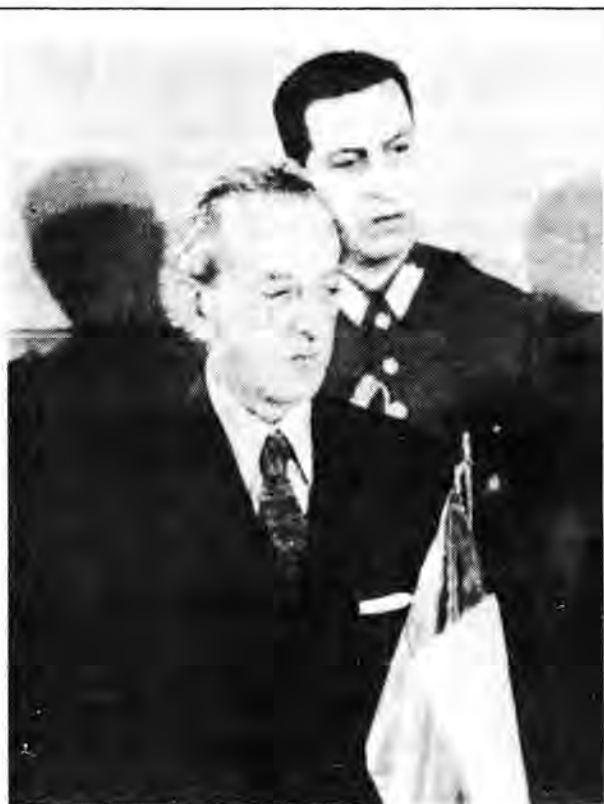
Carlos Briones. Último Ministro del Interior del Gobierno Popular: sincero esfuerzo por salvar el orden constitucional.