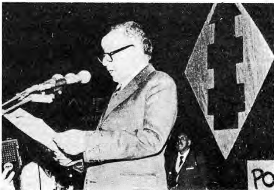
Bernardo Leighton; PDC; oposición en la legalidad.