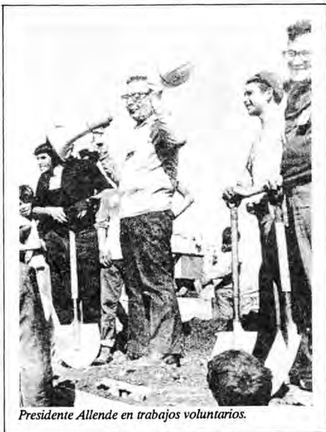
Presidente Allende en trabajos voluntarios.