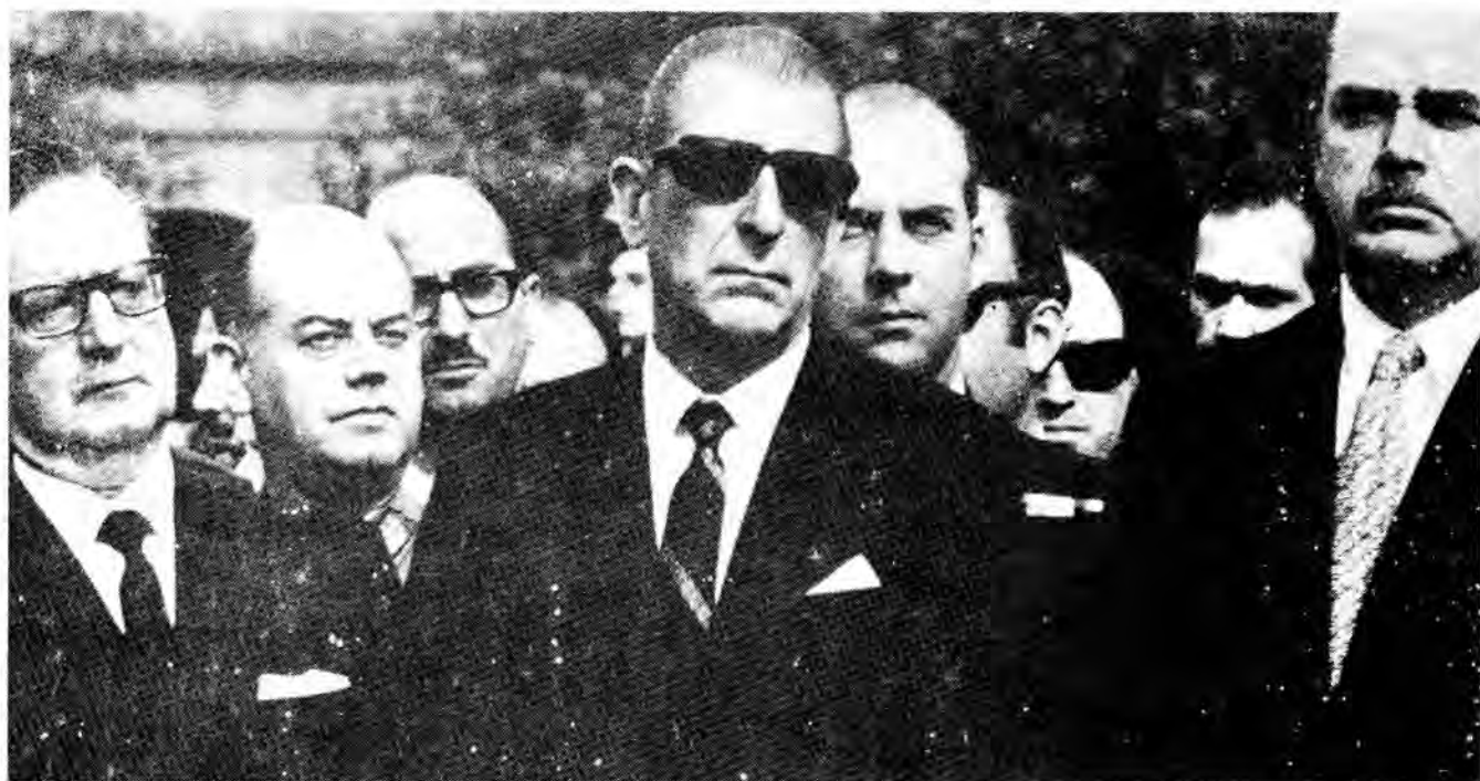
El Presidente Eduardo Frei, el Presidente Electo Salvador Allende y el Presidente del Senado Tomás Pablo E., en el funeral del General René Schneider Ch.

las Guarniciones de Chile. Allí pude escuchar y participar en el diálogo que abrió el Comandante en Jefe con Oficiales y Clases, para entregarles una doctrina y una orientación, que hiciera inconvencible la línea de conducta de nuestro Ejército. Y pude apreciar cómo sus palabras, sus ideas tan claras, orientaban y afirmaban el espíritu de la Institución. Cumplí con el encargo expreso del Presidente de la República, al señalar en esta hora la colaboración leal e inestimable que el General Schneider le prestó en todo momento en la tarea ineludible de un gobernante de conducir a su país por los cauces de la democracia”.