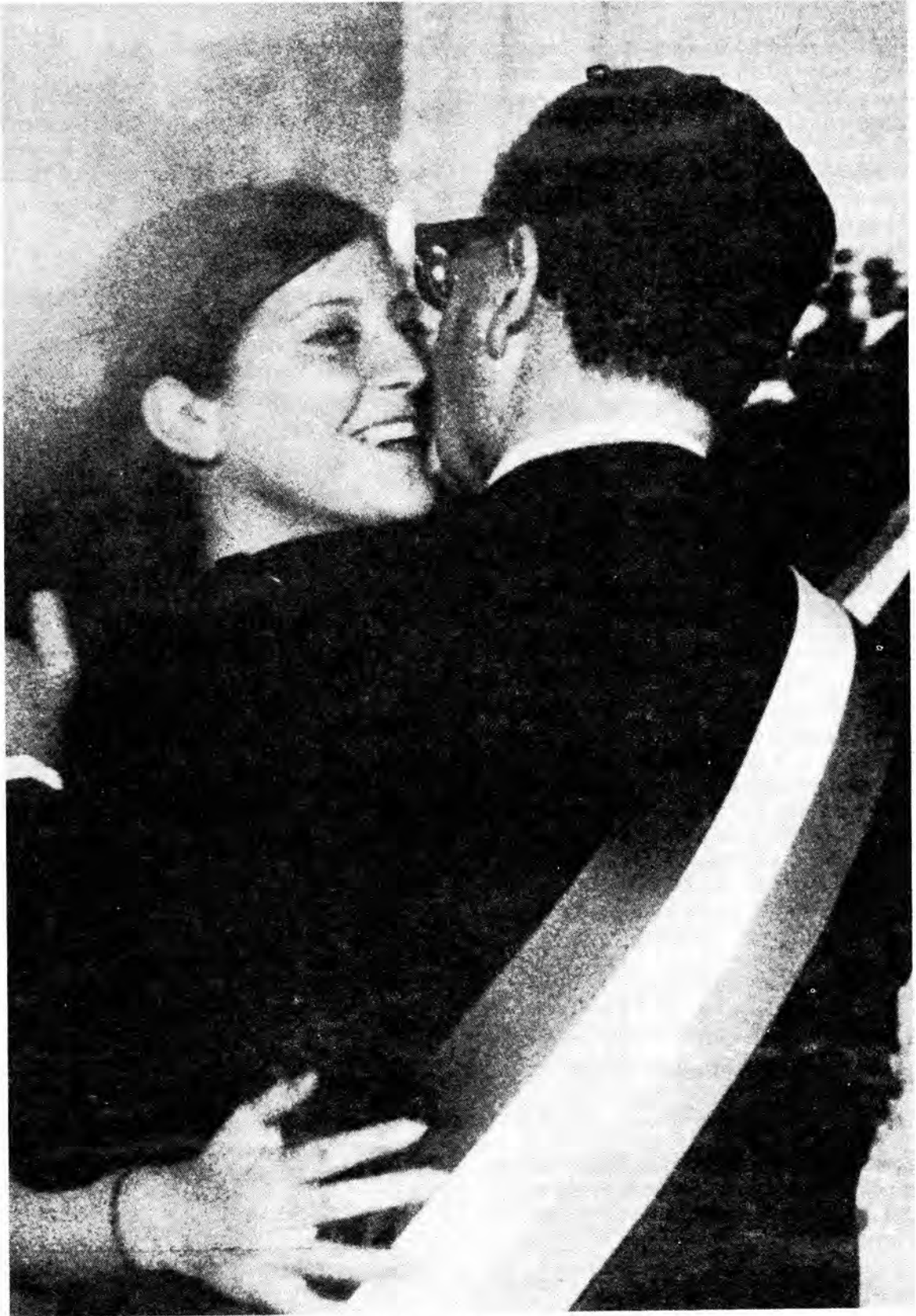
Su entrada en La Moneda cautivó las ilusiones de la juventud.