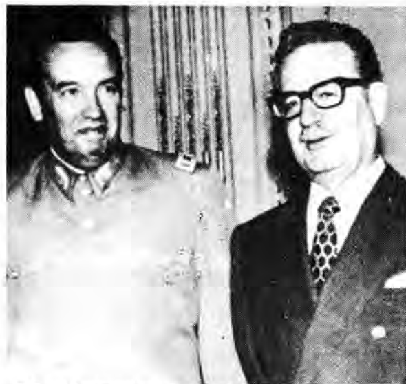
El Presidente Allende junto al General Pedro Palacios quien encabezó el asalto al Palacio de La Moneda el 11-IX-1973; acción que culminó con la muerte del Presidente.