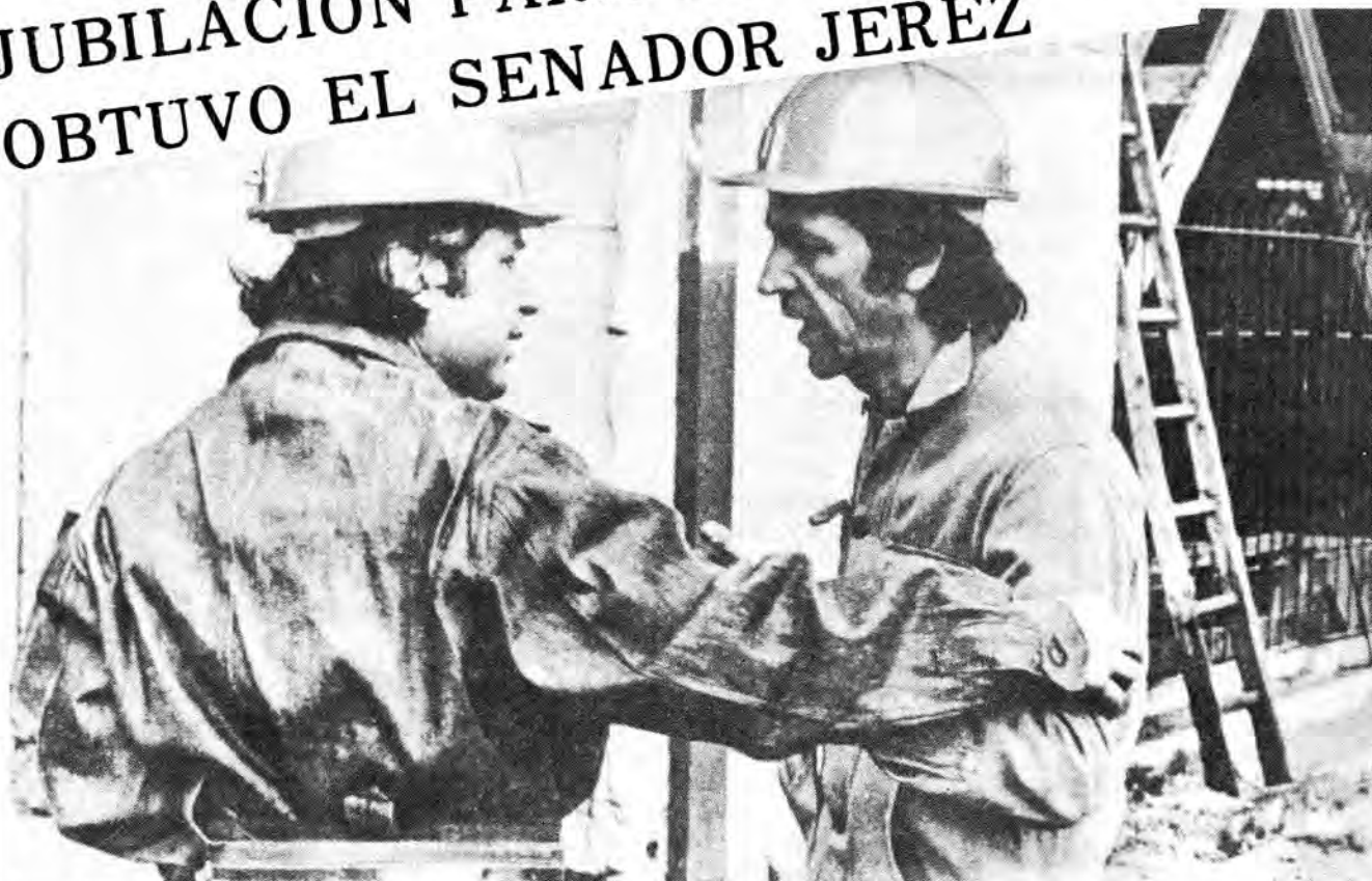
Con el senador Jerez antes de bajar a la mina de Lota. 1971