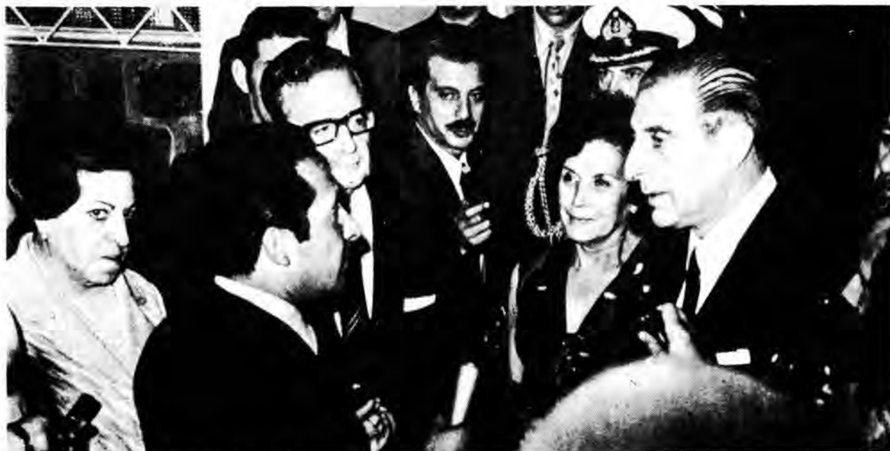
El Presidente de la República Eduardo Frei y su esposa, visitan al Presidente Electo Salvador Allende quien acompañado de su esposa lo recibe en su casa.