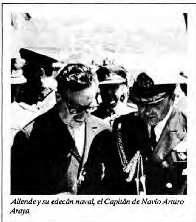
Allende y su edecán naval, el Capitán de Navío Arturo Araya.

por eso llamamos y apelamos a los campesinos, trabajadores, obreros, y la juventud, para romper este equilibrio hoy y radicalizar el proceso revolucionario”.