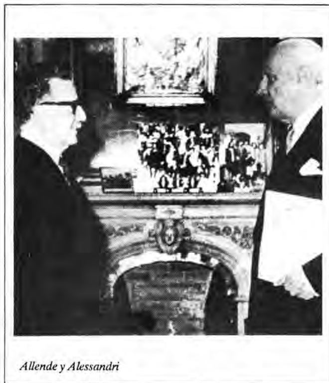
Allende y Alessandri

computarse un alza del 2.5 por ciento en Agosto último. De esta manera, la cifra para los ocho meses del año sobrepasa el total del año 1969, que fue del 29,3 por ciento.