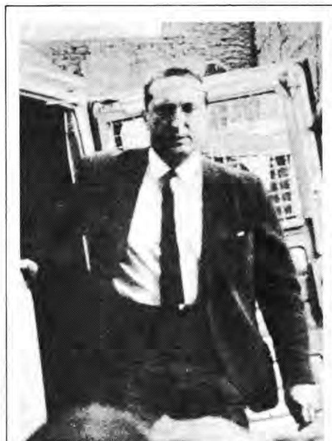
Roberto Viaux, uno de los cerebros del complot que culminó con la muerte del general Schneider.