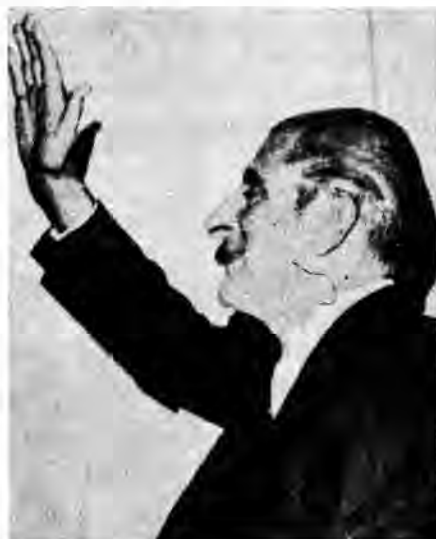
Eduardo Frei M.