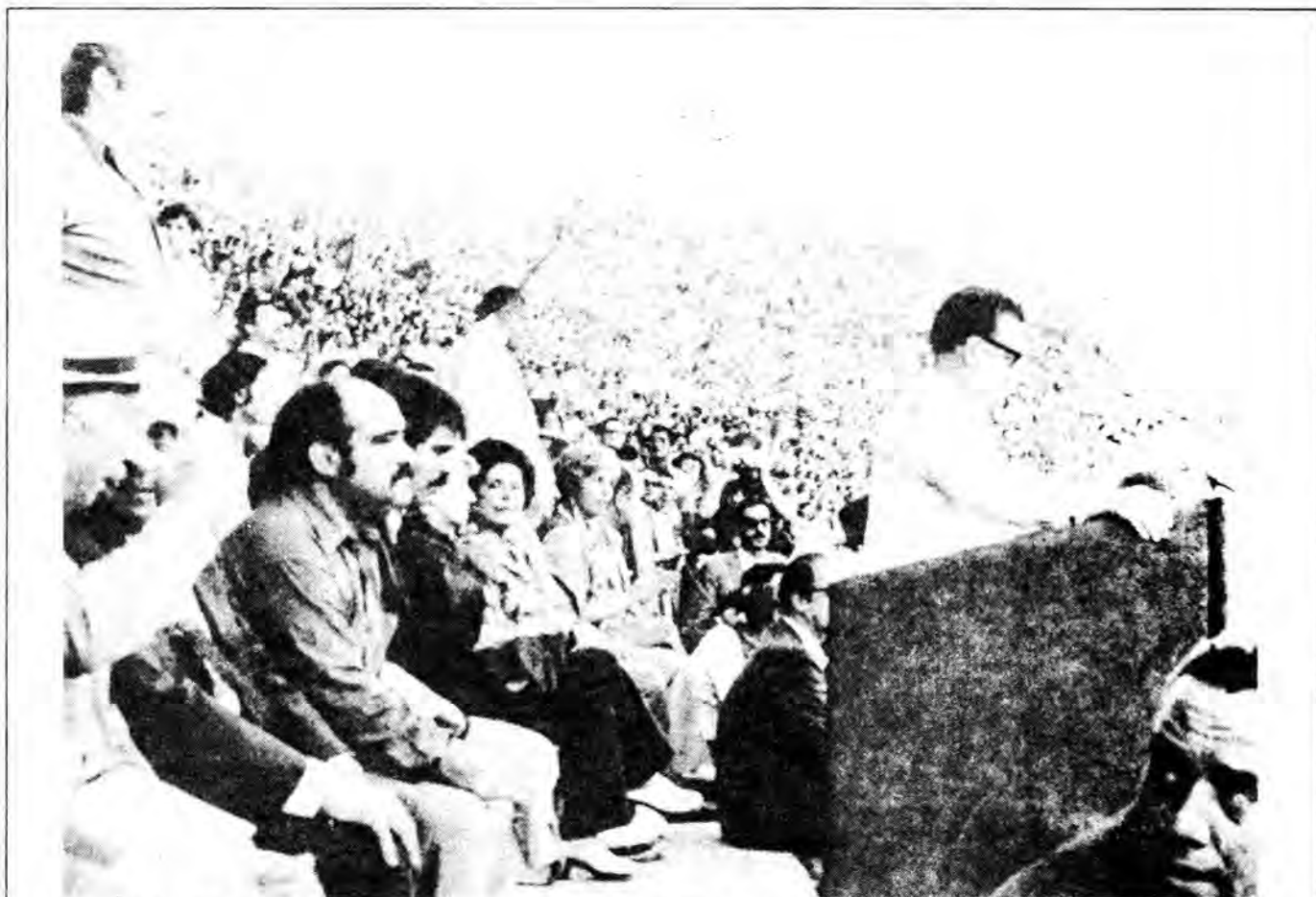
Presidente Allende habla en el acto del Estadio Nacional el 4 de noviembre de 1971.

“Y hemos acentuado y profundizado el proceso de reforma agraria: 1.300 predios de gran extensión, 2.400.000 hectáreas han sido expropiadas. En ellas vi-