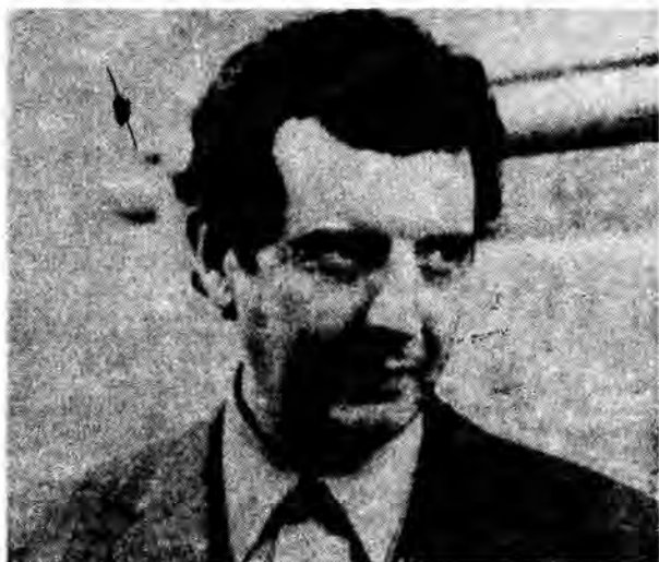
Ministro de Salud. Arturo Jirón.