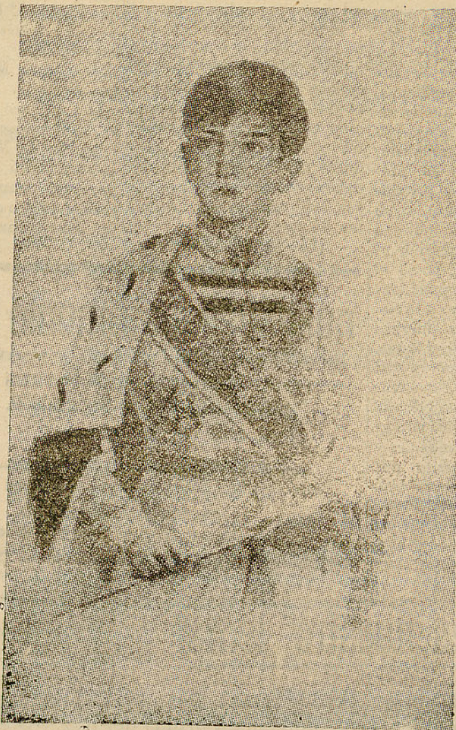
S. M. REY PEDRO II.

Año II | Punta Arenas, Marzo 28 de 1943 | Núm. 204