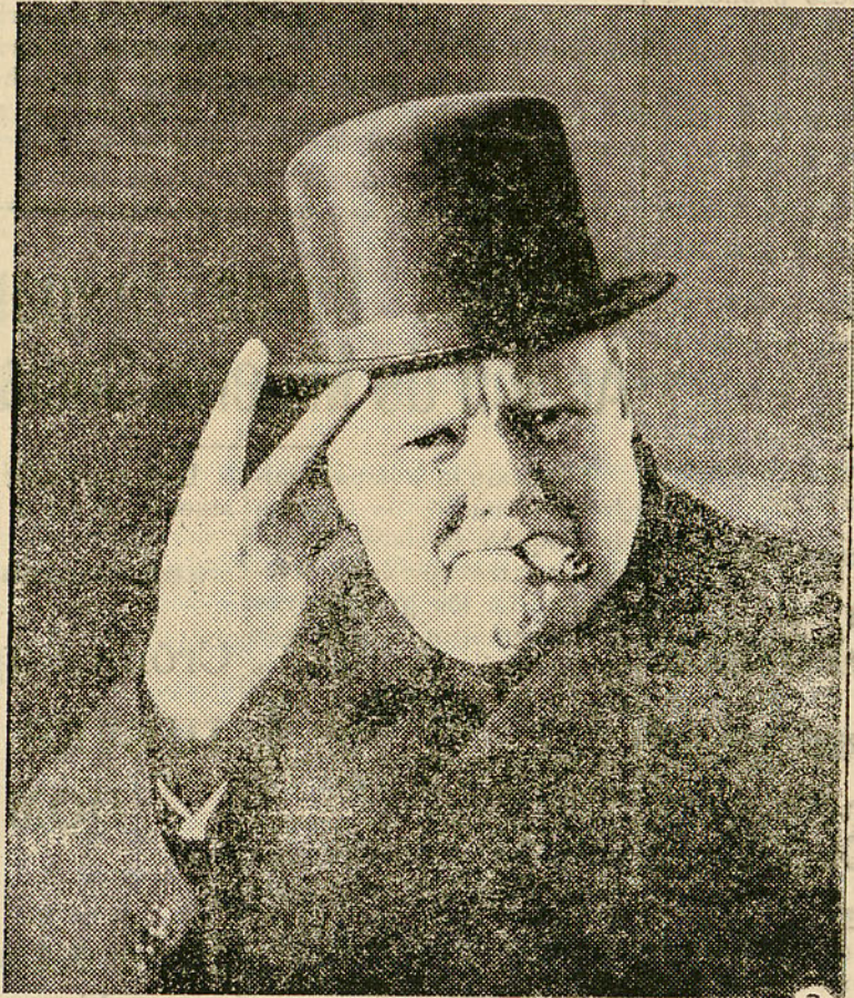
Mr. WINTON CHURCHILL: Primer Ministro de Gran Bretaña. Insigne piloto del Imperio Británico, que comanda la guerra de las Naciones Unidas, asegurando la victoria de los ideales democráticos

Sangre británica y sangre imperial salpica los campos de batalla. Y cuando el día de la Victoria tenga la realidad de los hechos consumados, el mundo liberado por las Naciones Unidas no podrá olvidar que fueron Gran Bretaña y el Imperio Británico, los pueblos que no cesaron, ni en los peores momentos, a defender la causa sagrada de la civilización de la libertad de los pueblos y de los humanos. J. de la P.