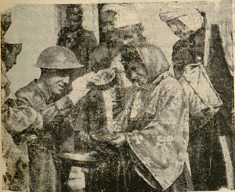
Los árabes dan la bienvenida a las tropas del Viejo Octavo Ejército Británico. Cuando las tropas británicas volvieron a entrar en Giovanni Berta (Libia), fueron muy bien recibidas por las nativos. La fotografía muestra a un soldado británico compartiendo su ración alimenticia con algunos de ellos.