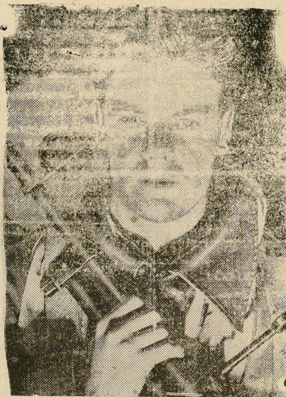
EN LA REAL FUEEZA AEREA SIRVEN SOLDADOS DE TODO EL IMPERIO BRITANICO. Un canadiense, ametrallorista de un bombardero, pres tó sus servicios en la Real Fuerza Aerea.