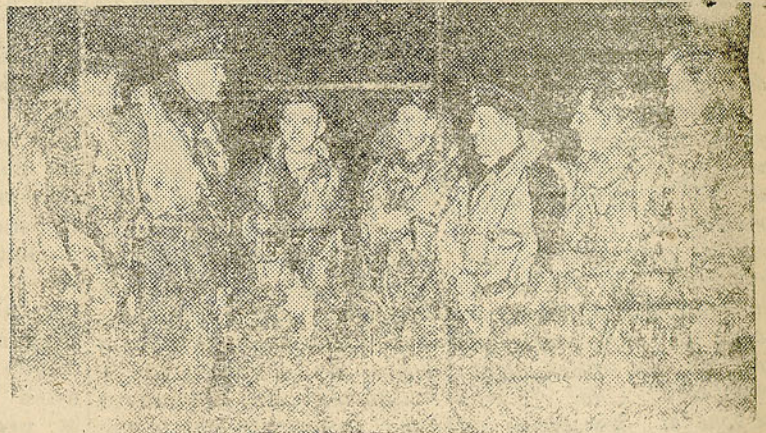
Intenso bombardeo sobre Berlin.— Estos pilotos de la R.F.A. comentan los incidentes de un concentrado bombardeo a la capital del Reich. Más de 100 incendios estallaron por las bombas arrojadas y sus llamas podían verse a 200 millas de distancia.—(Foto Bippa).