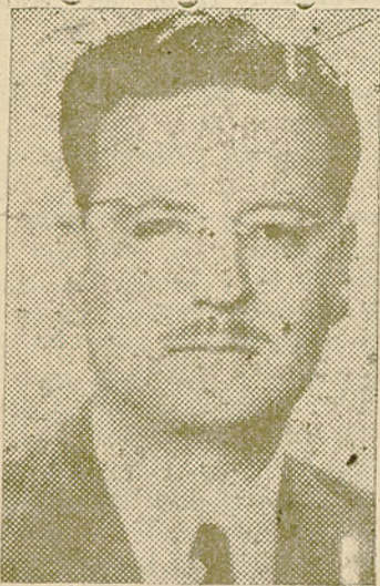
SALVADOR ALLENDE G. Medico