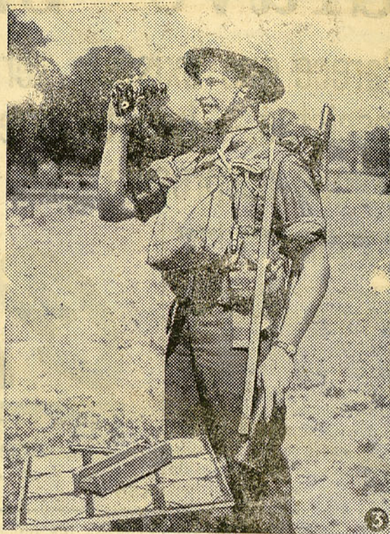
Vigía inglés de la costa que escudriña el cielo con poderosos anteojos de larga vista e informa de la incursión de aviones enemigos, cuando ellos se encuentran todavía a muchos kilómetros de distancia.