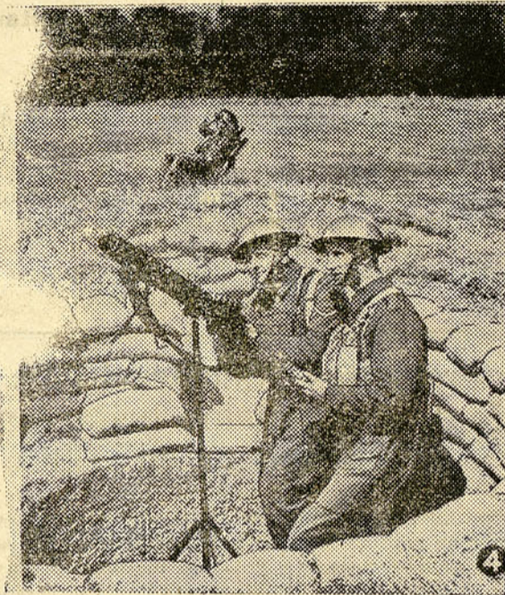
La ilustración muestra las defensas antiaéreas de un cañón antiaéreo. Estos dos hombres acaban de experimentar el placer de derribar un avión de caza enemigo que descendió demasiado con la intención de ametrallar a los sirvientes de esta batería.