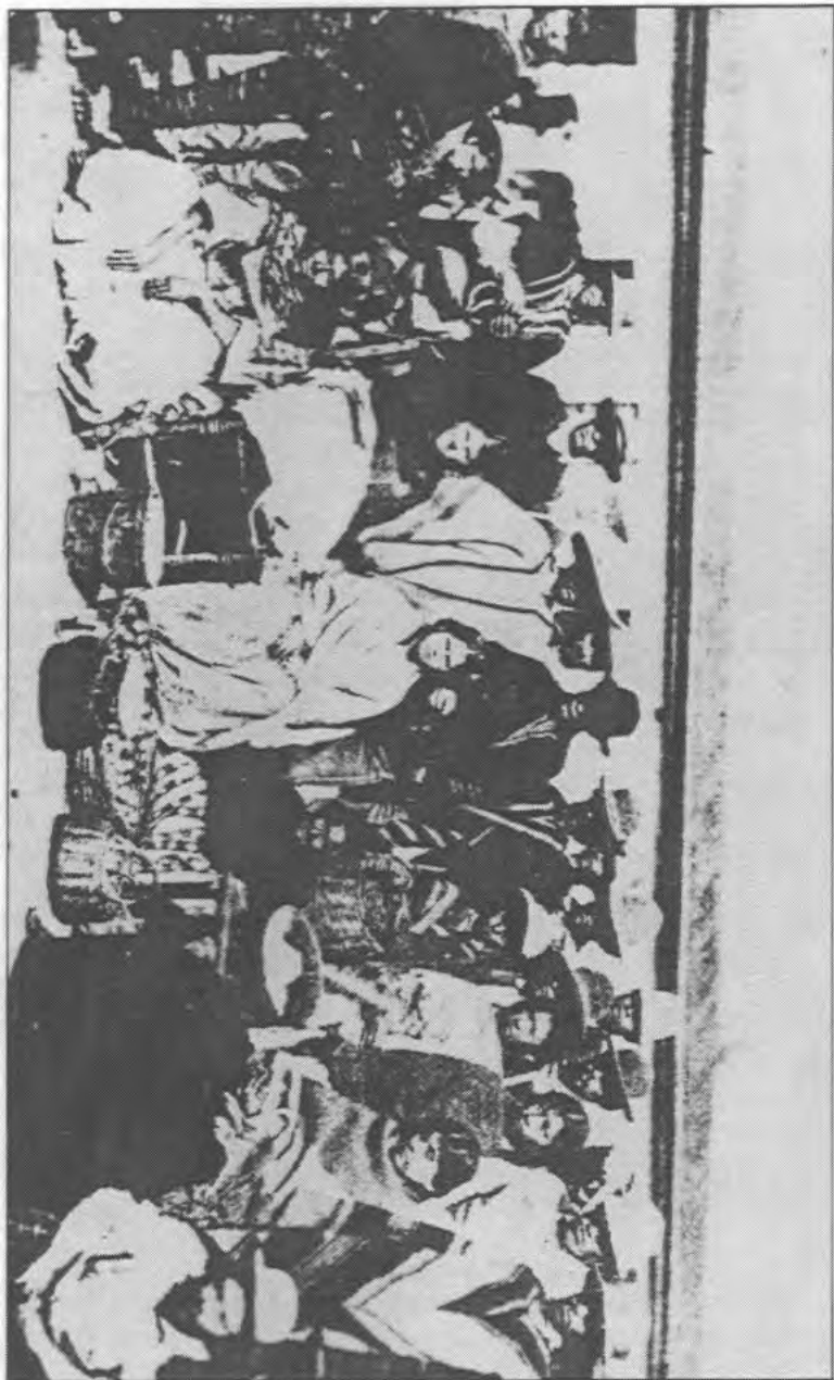
Vendedores de mote y frutas y gente del pueblo cerca de la Estación Central de Santiago (julio de 1861) (Pedro Ruiz Aldea, Tipos y costumbres de Chile (Santiago, Zig-Zag, 1947, pág. 204)).