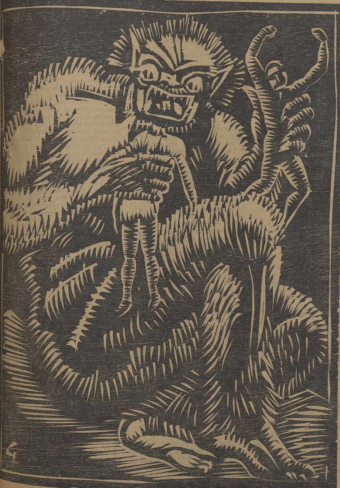
(MADERA DE GEO)