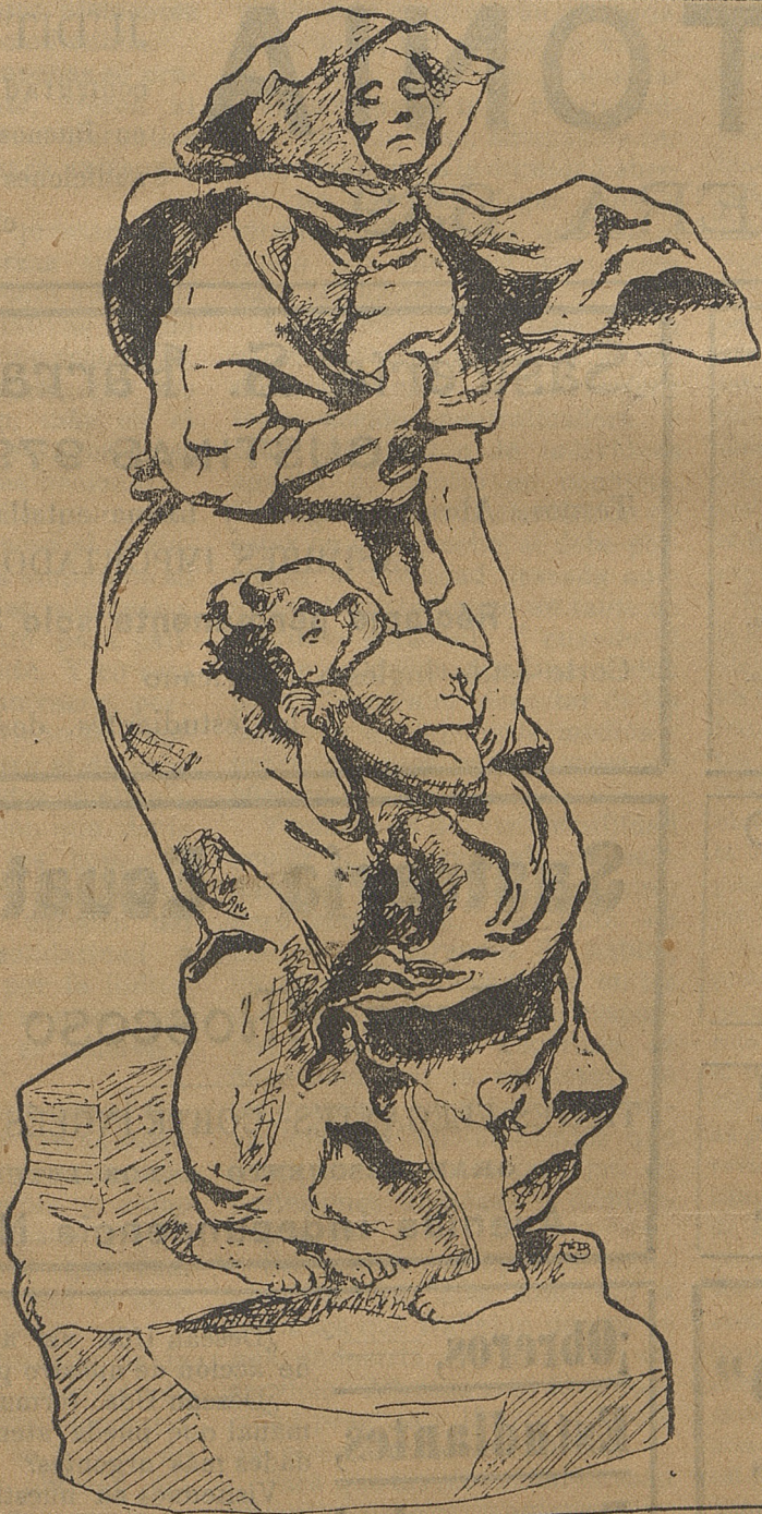
MISERIA (Escultura de CONCHA)