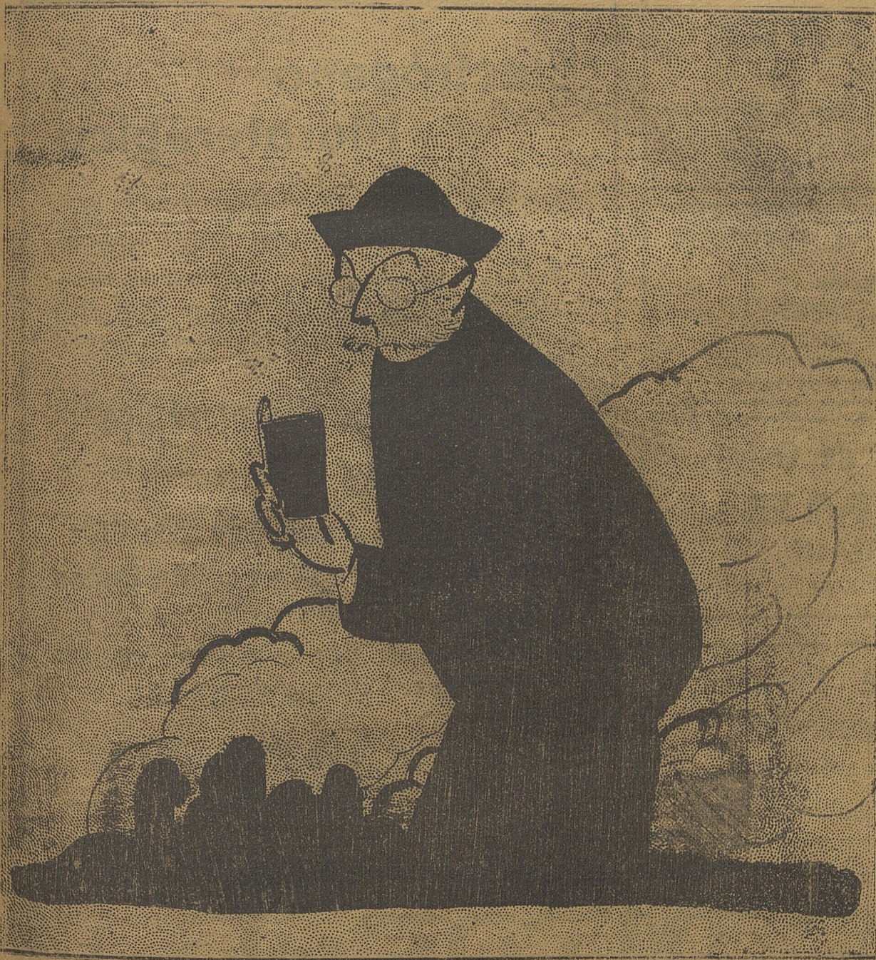
MIGUEL DE UNAMUNO