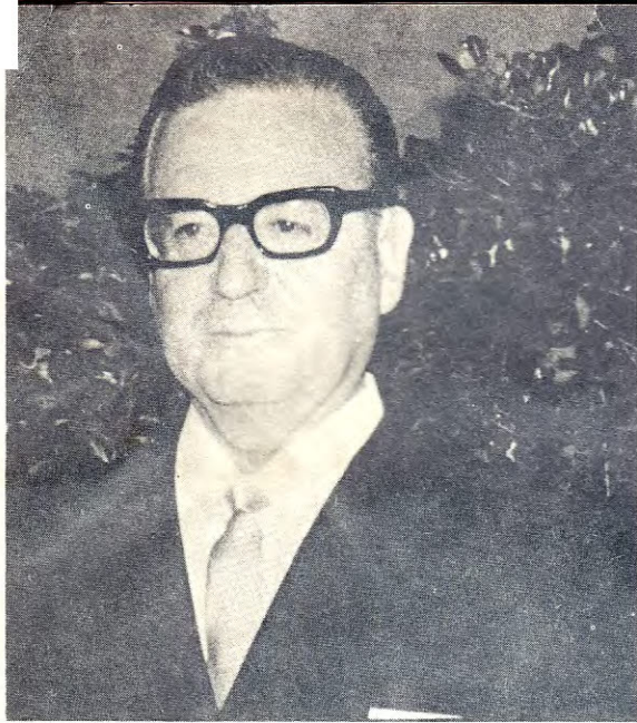
Ministro de Educación MARIO ASTORGA G.