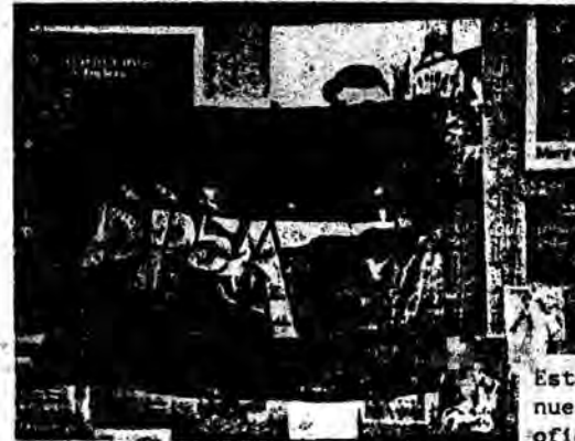
Esta es la bandera que dejaron nuestros combatientes en las oficinas de la UPI.

Cinco individuos, que se identificaron como miembros de los "Destacamentos Populares 5 de Abril", asaltaron a las 17.20 horas de ayer la agencia United Press International, ubicada en calle Natali Cox 47, 3° piso, con objeto de efectuar "una acción de propaganda armada".