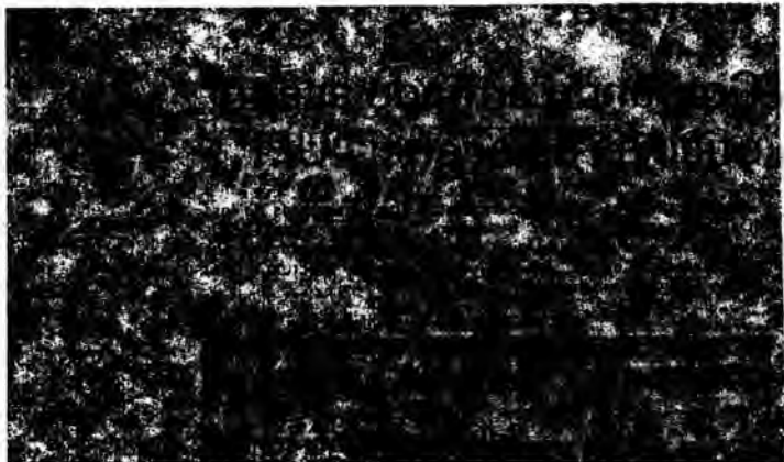
DESTACAMENTOS POPULARES 5 DE ABRIL

SOLDADO: UNETE AL PUEBLO PARA DEFENDER LA PATRIA